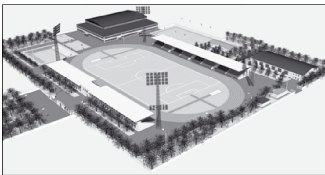
■ Таким будет стадион «Чайка».

Реконструкция, строительство новых объектов на «Чайке» уже сегодня требуют от руководителей городского округа и управы Ленинского района самого пристального внимания к инфраструктуре прилегающей к стадиону территории, ее благоустройству. Необходимо построить остановочные павильоны, обустроить парковки для автотранспорта. И, конечно, решить самую сложную проблему – транспортную, продумав новые маршруты, которые могли бы связать с «Чайкой» все городские районы.