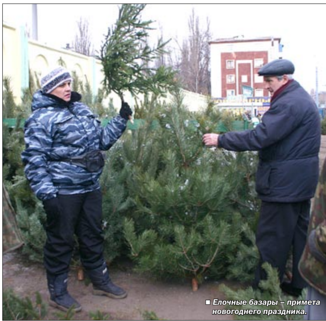
■ Елочные базары - примета новогоднего праздника.