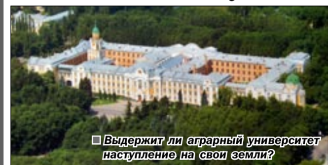
Выдержит ли аграрный университет наступление на свои земли?