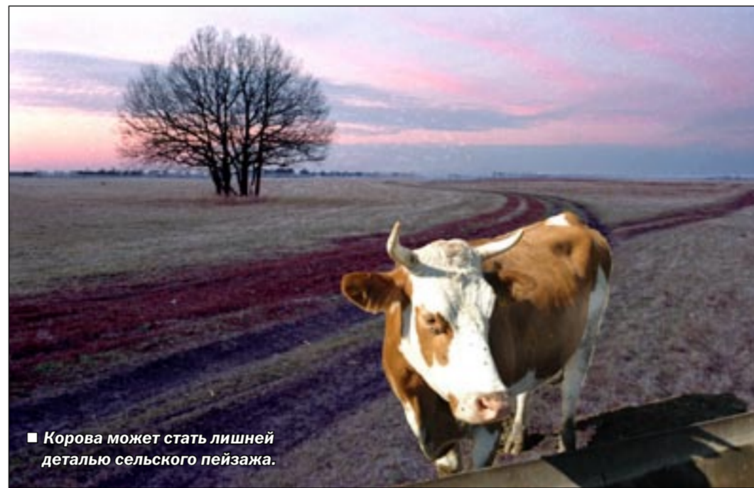
Корова может стать лишней деталью сельского пейзажа.

печати сообщают, что из-за неурожая Австралия и Новая Зеландия сократили импорт сухого молока. Так что в странах Европы поднялся спрос на местную молочную продукцию. В связи с этим Евросоюз отменил некоторые дотации своим фермерам, лишив их части государственной поддержки. В результате европейское молоко, а также сыры и сливочное масло у себя дома подорожали. Вроде бы это их проблемы. Но они, утверждая наши рыночники, «крикешетом» коснулись и нас, поскольку страны Европы кормят и Россию. До прошлого года июля тамошних животноводов за каждый килограмм сыра или масла, отправляемого за границу, получал 0,33 евро (11 рублей 64 копейки по курсу Центробанка). Он мог товаром подешевле привлечь к себе покупателя. Теперь эту дотацию ему не платят. Фермер вынужден включить ее в стоимость продукта, переложить на потребителя. Европейские цены засияли в наших супермаркетах. А на них равняются отечественные «молокодобытчики».