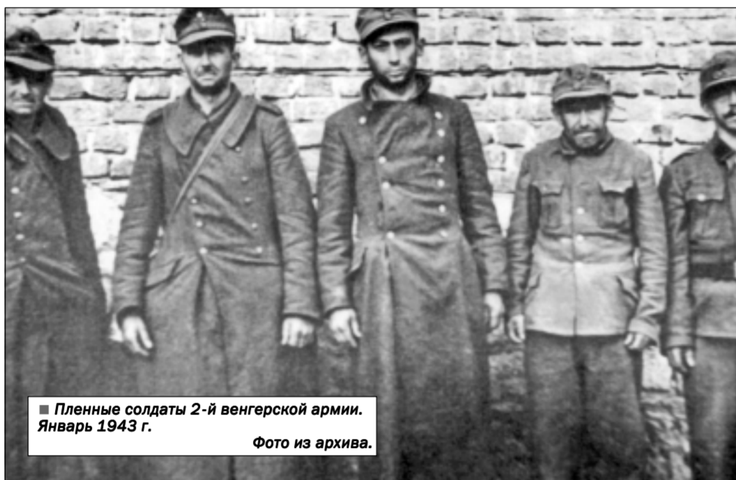
Пленные солдаты 2-й венгерской армии. Январь 1943 г.