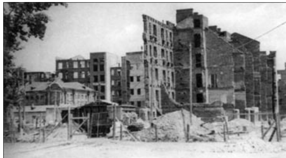
■ 1943 год. Освобожденный Воронеж лежит в руинах. На левом снимке - дома на проспекте Революции, на правом - разрушенное здание Управления ЮВЖД. Эти фотографии из только что вышедшей книги Стяла Пензина «Мой Воронеж после войны». Рассказ о книге - на 8-й странице.