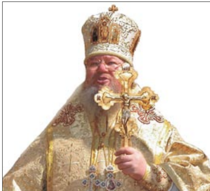
Его Высокопреосвященству, Высокопреосвященнейшему Сергию, митрополиту Воронежскому и Борисоглебскому