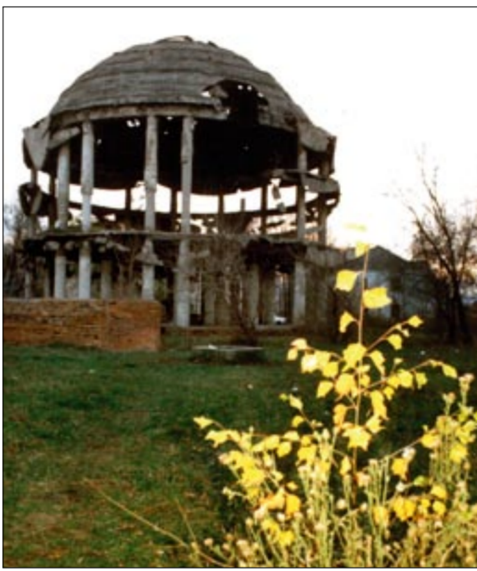
■ Память о войне.