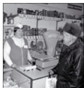
■ В магазине села Малая Грибовка.

Грибановские кооператоры стремятся улучшить торговое обслуживание жителей района. Потребитель-