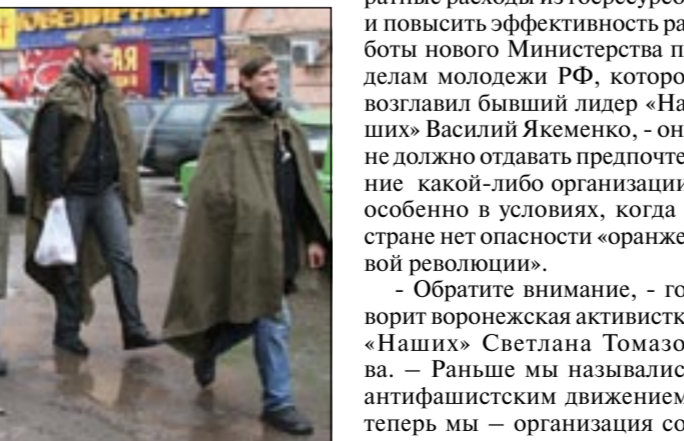
Материалы подготовили журналисты газеты «Репьевские вести».