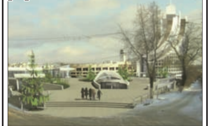
■ Так быть или не быть площади Детей такой?

На днях во Дворце творчества детей и молодежи прошли публичные слушания по вопросу комплексного освоения земельных участков в целях строительства многоквартирных жилых домов со встроенными и подземными автостоянками по адресам: пер. Детский, 14; ул. Авиационная, 4а; культурно-оздоровительного центра на ул. Авиационная, 6а, и планировки территории по указанным адресам.