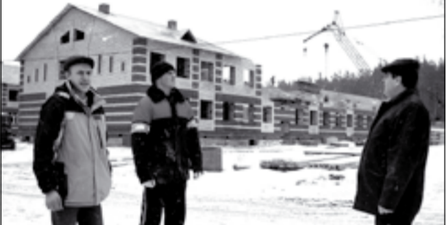
Строительство Шуберской школы.

На очереди — строительство аналогичного здания Синицынской СОШ.