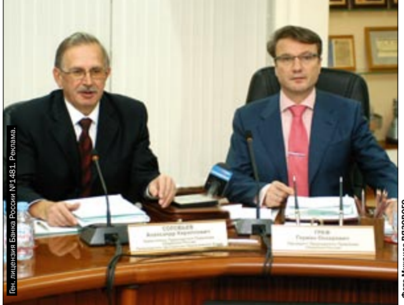
Пос. Владимир Бланов.