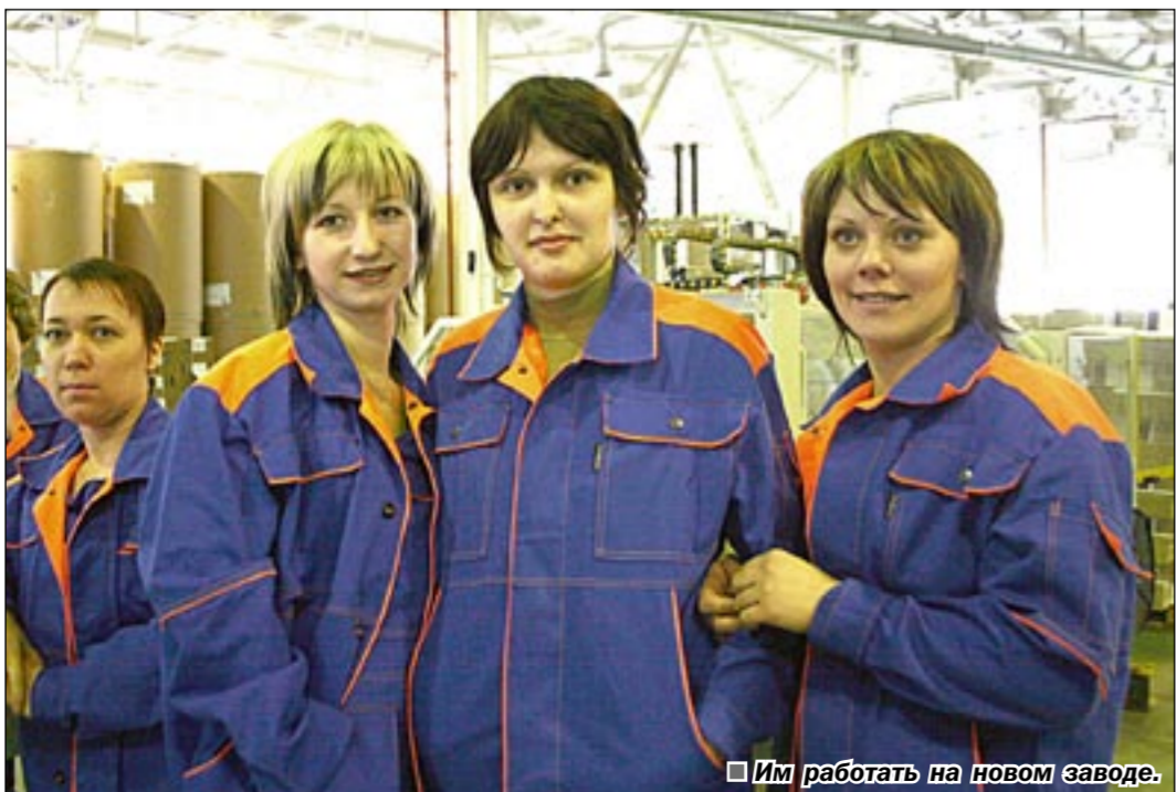
Им работать на новом заводе.

Справочная 0-84 (4732) 466-445 www.spravkavrn.ru