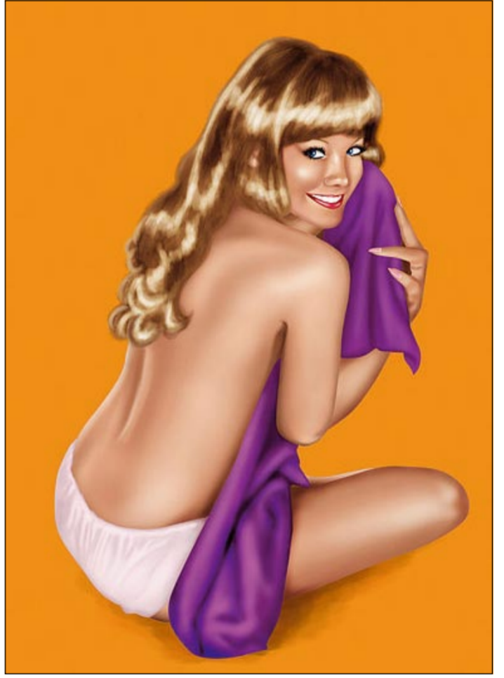
Вовлечением и принуждением к проституции, а также организацией притонов.

английский писатель Редьярд Киплинг. И действительно, сведения о ее существовании известны со времен глубокой древности и датируются 2-3 тысячелетиями до н.э. Само же слово произошло от римского «prostrare» — продаваться публично или проституировать для удовлетворения сексуальных потребностей за вознаграждение. Это явление получило значительное распространение в древнем мире: в Египте, Вавилоне, Греции, Риме, Персии, Индии, Китае, где на протяжении многих веков существовали многочисленные дома терпимости. А первым в истории сутенером принято считать греческого императора Солона (между 640 и 635 — ок. 559 до н.э.), который учредил государственные бордели, приобрел для них рабынь и предлагал их в общее пользование за плату в один обол. С тех пор на протяжении многих веков проституция существовала в более или менее открытой форме во многих странах. Временами ее начи-