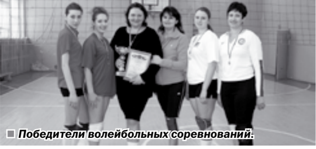
Победители волейбольных соревнований. Материалы подготовили В.СМОЛИНА, Ю.ПЕРЕЛЫГИНА.

Спор за почётной трофеей — кубок района — ведут лучшие мужские и женские команды. Кроме того, призы соревнующимся получают бесплатную подписку на районную газету. Недавно завершился первый этап нового розыгрыша турнира на приз «Нивы» среди женских команд. В итоге упорной борьбы победу одержала сборная райцентра (на снимке).