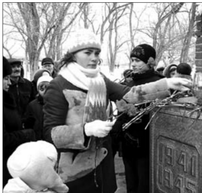
У мемориальной доски Михаилу Кузьменко.

На старинном земском здании школы села Кричиное Россоанского района принародно открыта мемориальная доска. На ней портрет война. Здесь учился участник Великой Отечественной войны, полный кавалер ордена Славы Михаил Кузьменко.