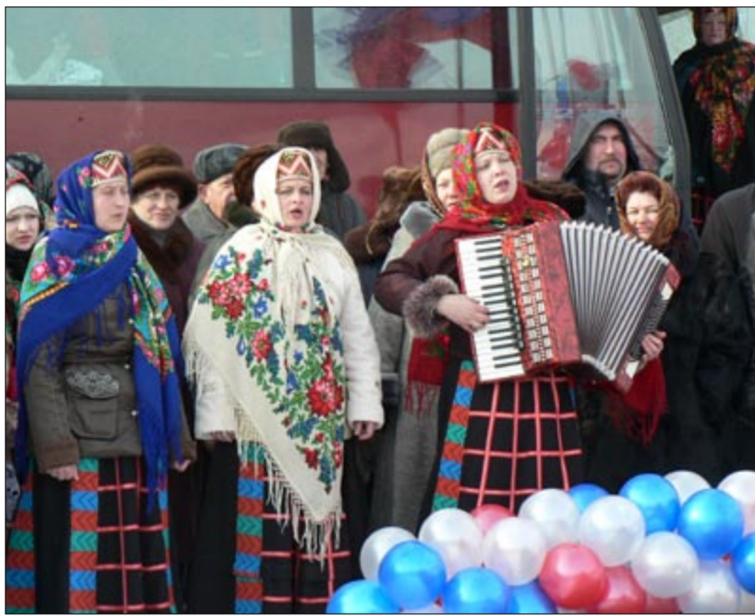
В Губарях праздник.