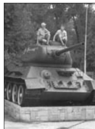
Ревятишки любят военную музейную технику. Только любовь бывает разная...

В ночь со среды на четверг неизвестные оксфордили технику времен Великой Отечественной войны, стоящую перед Музеем-диорамой.