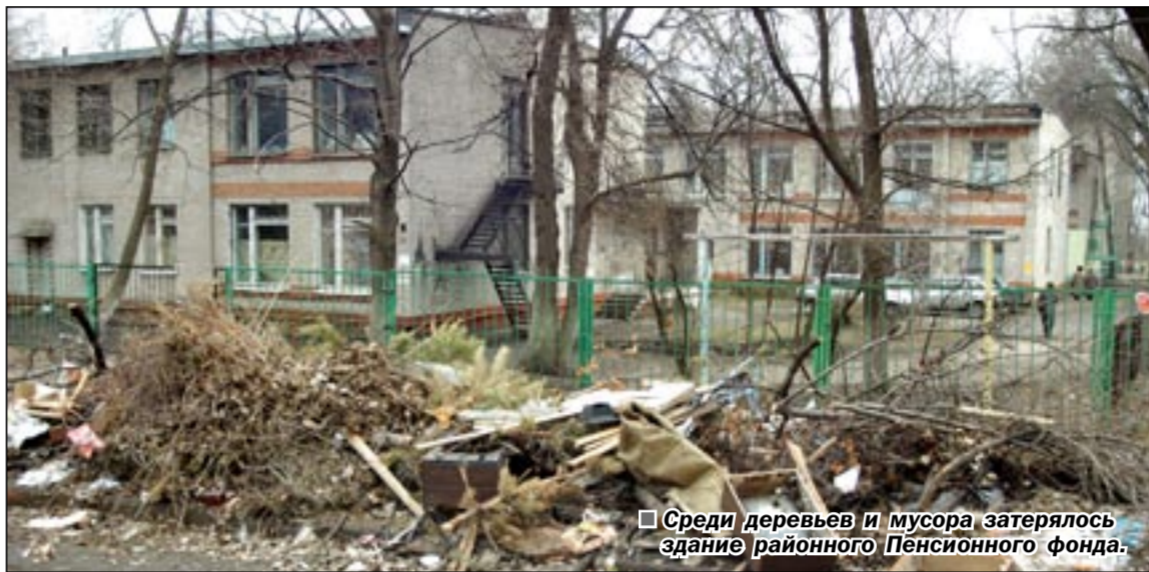
Среди деревьев и мусора затерялось здание районного Пенсионного фонда.