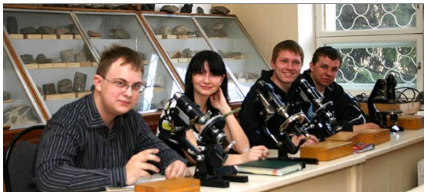
Студенты второго курса геологического факультета ВГУ.