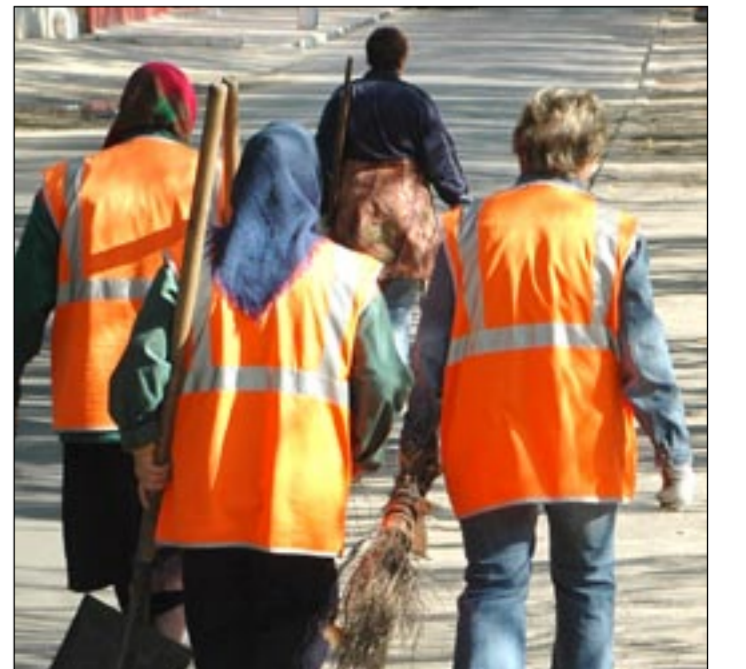
Все на уборку!