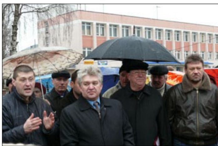
Шумно на центральной площади поселка.

«Коммуна» продолжает следить за послевыборной ситуацией в Рамони. Недавно там состоялось организационное заседание депутатов нового, IV созыва