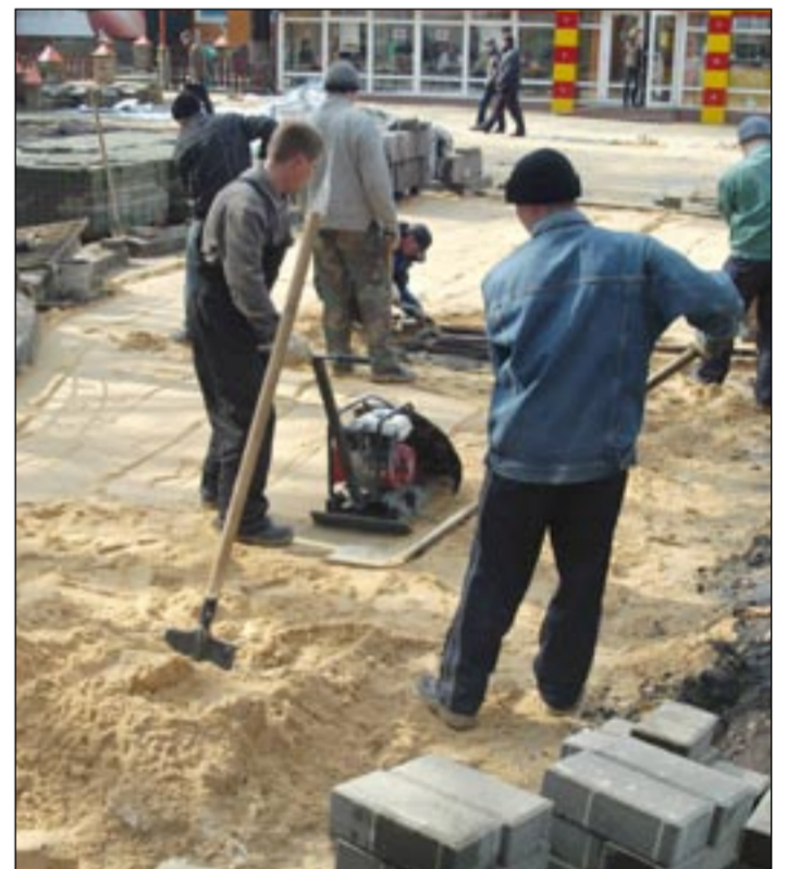
Строительная бригада завода архитектурного бетона ведет укладку тротуарной плитки на улице К.Маркса.

В Воронеже начался месячник по благоустройству. Участие в уборке города принимают не только работники коммунальных служб, но и студенты, школьники, трудовые коллективы и просто жители Воронежа, которым выдаются талоны на улицах и во дворах.