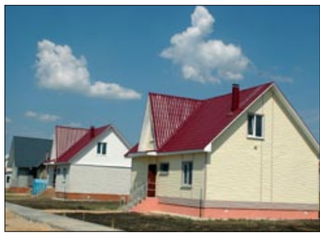
Решат ли эти прелестьные коттеджи жилищную проблему?