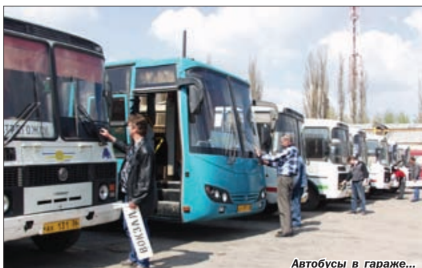
Автобусы в гараже...

коэффициент умножается базовая доходность одного места — наличие и забота о комфорте для пассажиров, и поддержка автоперевозчиков. И подобные коэффициенты были утверждены практически во всех районах области. Например, в Бутурлиновке ещё в октябре прошлого года.