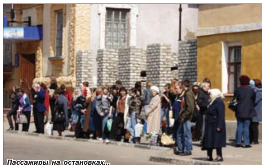
Пассажиры на остановках...

Абсурдность налогового нововведения для автопредприятий, осуществляющих пассажирские перевозки в провинции, кстати, хорошо поняли на уровне области. Так, областная комиссия по вопросам улучшения транспортного обслуживания при губернаторе области рекомендовала главам местного самоуправления вести так называемый понижающий коэффициент К2. Суть его в том, что чем выше вместимость автобуса, тем на меньший