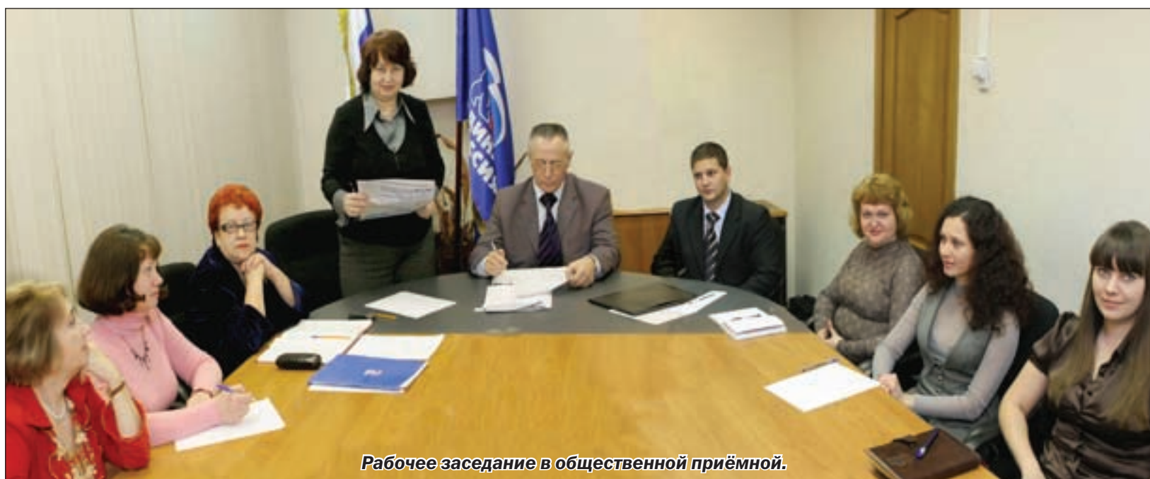
Рабочее заседание в общественной приёмной.

Поток писем и обращений значительно увеличивается во время избирательных кампаний. Но и их завершение вопросы у граждан не исчерпываются. Депутаты Госдумы только часть времени проводят в округах. Депутаты областной Думы и органы местного самоуправления, конечно, ближе к населению. Однако и они не имеют возможности ежедневно вести приём граждан. Формирование подобной сети позволяет наиболее эффектив-