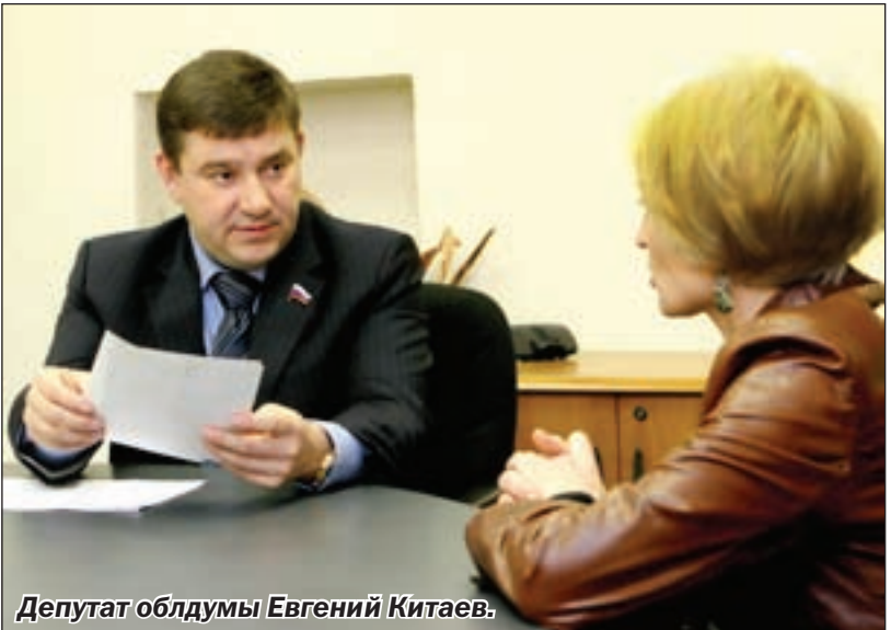
Депутат облдумы Евгений Китаев.