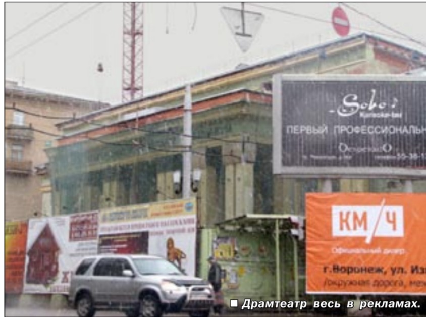
Драмтеатр весь в рекламах.