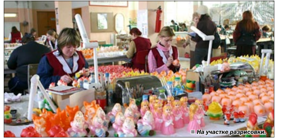
На участке разрисовки.

Нашей главной задачей является качество и безопасность игрушки, - ответственно заявляет она как работница и мама маленького ребенка. - Для этого в производство внедряются, прежде всего, новые технологии изготовления игрушек из экологически чистых материалов. Специалисты нашей лаборатории работают в тесном контакте с учеными технологической академии. Теперь это уже не является большим секретом, но общими усилиями инжене-