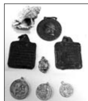
Фашистские знаки отличия и медальоны.

Старожилы припомнили, что случилось это в дни фашистской оккупации в 1942 году.