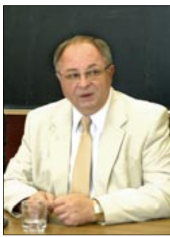
Специалисту — деньги и гарантии

Рынок труда несбалансирован с рынком образовательных услуг. Конечно, в таком конгломерате можно будет оптимально перемещать силы в те специальности, которые сегодня остро нужны рынку труда. В силу того, что строительный комплекс сегодня на подъеме, у нас, например, стопроцентное трудоустройство выпускников. В техническом университете тоже хорошее трудоустройство, но есть недочеты. Кто сейчас может заказать специалистов по робототехнике или по металлу металлов давлением, когда машиностроение в Воронеже упало? Микроэлектроника скукожилась, как шагреневая кожа. Здесь нужен целевой заказ от администрации области.