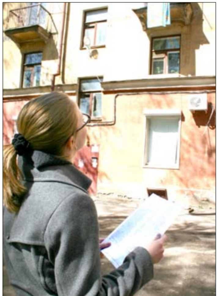
Очень много домов просится в список на капремонт.