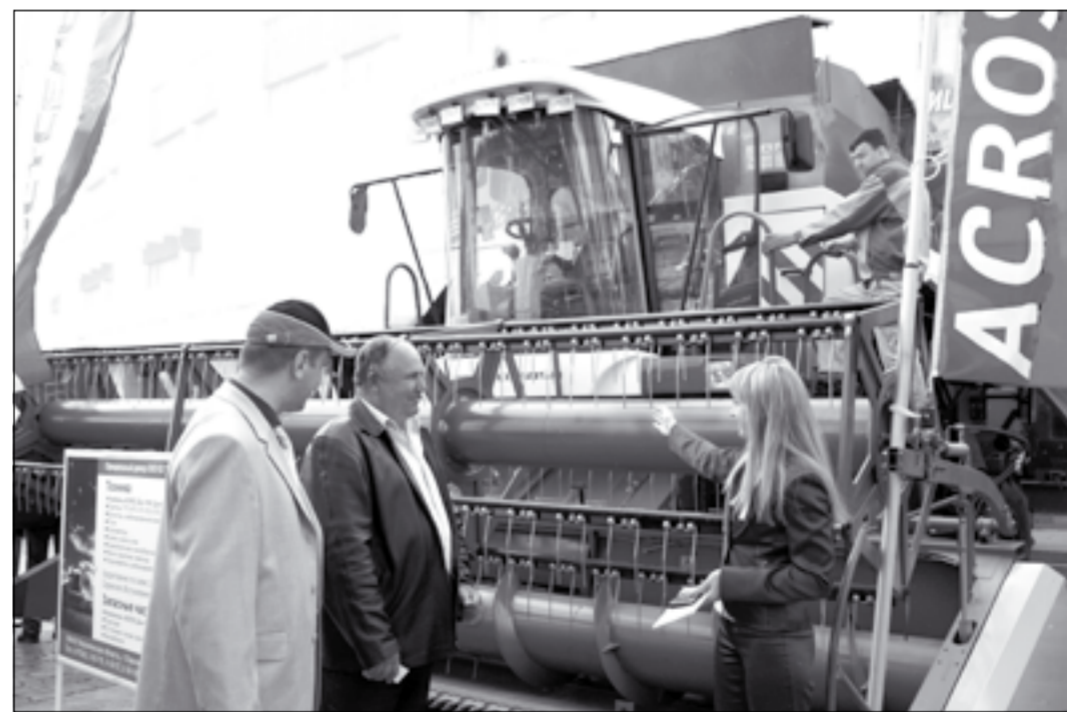
На выставке «Агропром-2008» в Воронеже комбайн ACROS 530 вновь оказался в центре внимания.

Вот и на выставке «Агропром-2008» желающих побывать в кабине ACROS 530 было не счесть. И, соответственно, не счесть самых высоких и самых похвальных оценок. Оно и понятно. Обзор отсюда, благодаря огромным панорамным стёклам, - практически во все стороны. Здесь два кресла - одно, поддресоренное, для комбайнёра и второе, откидное, для его помощника. За работой всех механизмов комбайна строго следит бортовая информационная система Adviser. Помимо многих других, у неё есть ещё одно свойство, уже сумевшее произвести неизгладимое впечатление на механизаторов-голосовое оповещение. То есть в случае какой-либо проблемной