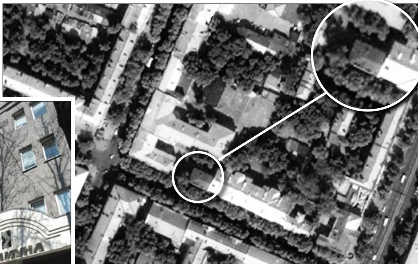
...А этот снимок сделан американским спутником – так из космоса смотрится крыша нашего здания (слева – школа №28, справа – жилой дом).