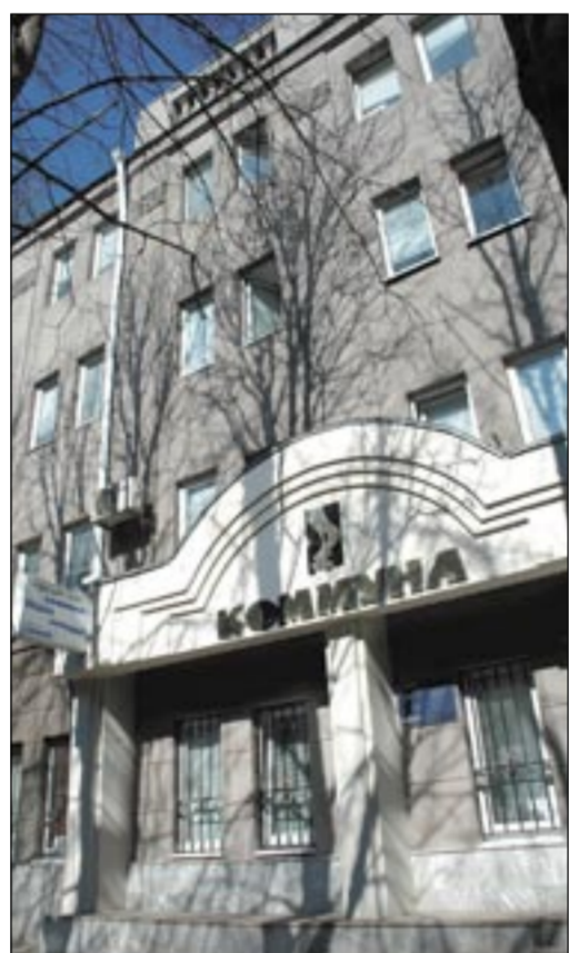
В этом здании по улице Комиссаржевской, 4а, в Воронеже «Коммуна» располагается последние десять лет.

Накануне юбилейного дня у нас спрашивали, как лучше поздравить, что подарить редакции. Отвечаем: лучший подарок – это остаться читателем «Коммуны». Так что, кто ещё раздумывает, спешите на почту!