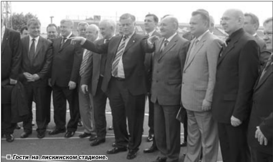
Гости на лискинском стадионе.