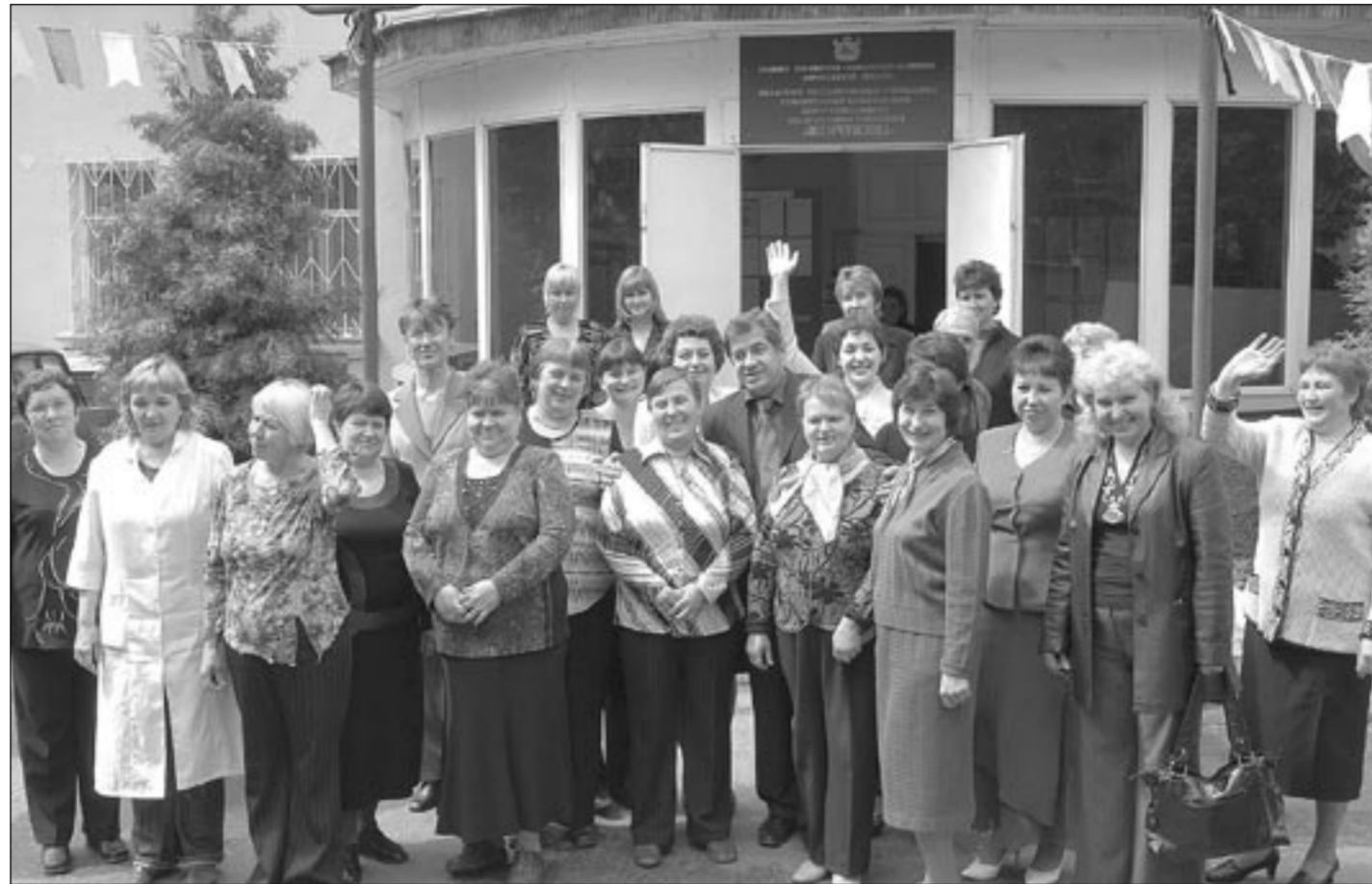
Коллективный портрет работников комплексного центра социального обслуживания Левобережного района Воронежа.

Глава городского округа город Воронеж С.М.КОЛИУХ Председатель Воронежской городской думы А.Н.ШИПУЛИН