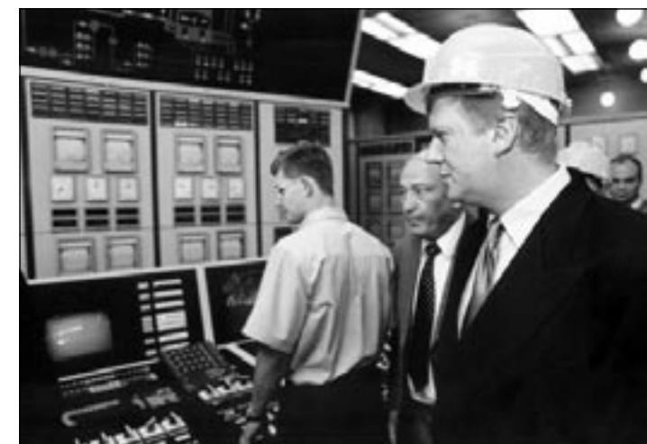
Чубайс расстаётся с «рубильником».

С 1 июля в электроэнергетике России переходный период к рыночным отношениям считается завершённым. Прекращает свою деятельность РАО «ЕЭС России». Декларируемое Чубайсом как «открытая компания» акционерное общество закрыто. Все операции по купле-продаже акций РАО «ЕЭС России» с 6 июня — дата закрытия реестра — считаются незаконными.