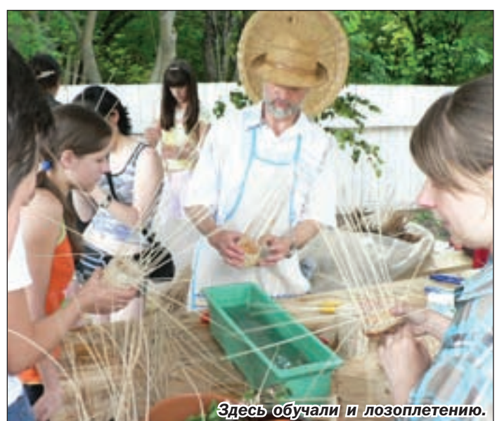
Здесь обучали и лозоплетению.

Открытие фестиваля — 20 июня в 21.00. Проезд на автобусах №№22 и 113 от железнодорожного вокзала и автовокзала до ост. «Ближние сады». Дальше — по указателям.