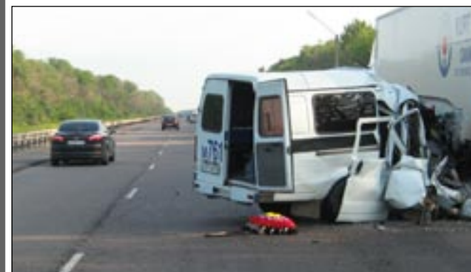
Семь человек погибли в результате двух крупных аварий, которые произошли на днях в области.

Вечером 13 июня на автодороге Воронеж — Луганск столкнулись сразу несколько машин. 30-летний водитель «Тойоты» возвращался вместе с тремя попутчиками, другом и двумя девушками, из Каменки в Острогожск. Он пересёк две сплошные линии и выехал на встречную полосу. В результате столкновения машин погибли четыре человека: водитель «Тойоты» и два пассажира, а также 25-летний мужчина, который был за рулем автомобиля ВАЗ-2106. Двое получили ранения. По злой иронии судьбы водитель «Тойоты» не доехал 50 метров до того места, где несколько лет назад в также результате аварии погиб его брат.