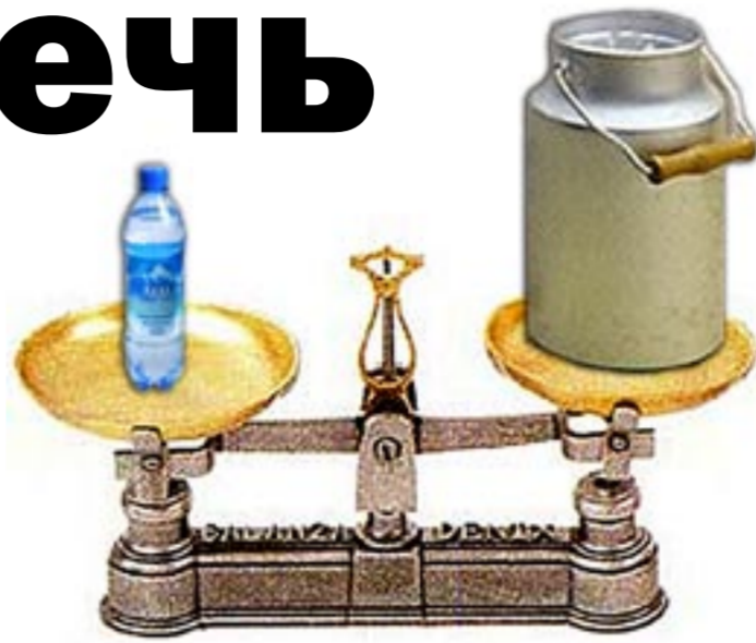
Коллаж Дарья Воробьевой.

Хочется задать вопрос: почему сегодня, когда действуют приоритетные программы для развития села, допускается