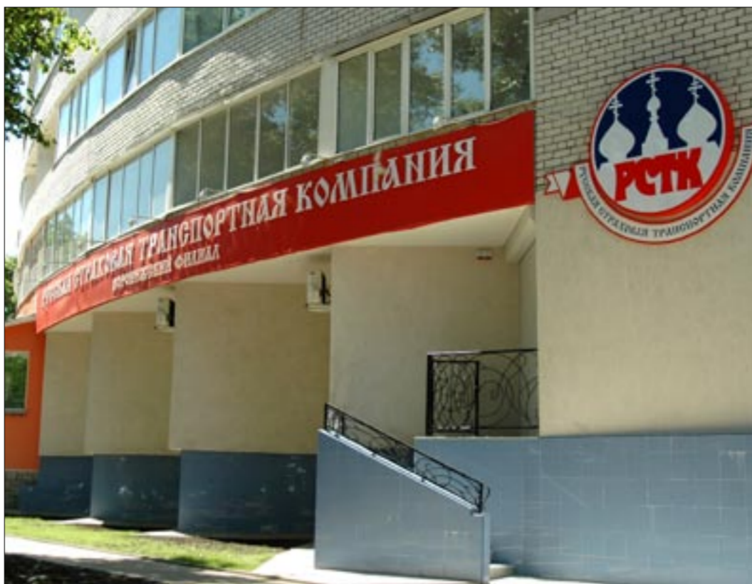
СЧАСТЛИВОГО ВАМ ОТДЫХА! Наши адреса в Воронеже: ул. 25 Октября, дом 45, офис 312, тел. 55-47-32; ул. Беговая, дом 2/3, тел. 75-57-50.

Учитывая рост инфляции, мы с 20 июня 2008 года увеличиваем страховую ответственность по добровольному страхованию пассажиров на междугородних автобусных маршрутах с 35 000 до 50 000 рублей. Кроме этого, по желанию у нас вы можете застраховать себя и членов своей семьи от всех несчастных случаев как дома, так на работе и отдыхе со страховой ответственностью от 50 000 до 500 000 рублей.