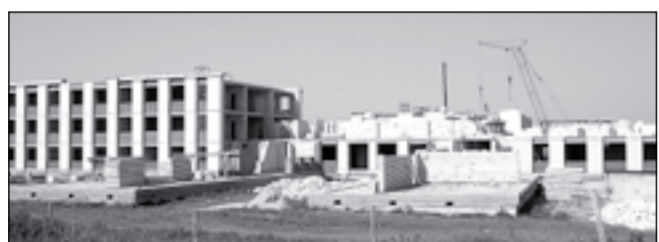
В эту новую школу райцентра осенью будущего 2009 года придут учиться 1200 учащихся.