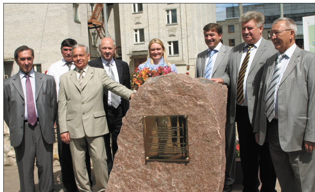
Этот камень извещал о начале реконструкции ТЭЦ-2.

Сегодня «Коммуна» вышла с приложением «Деловой вестник», который распространяется вместе с ней в розничной сети.