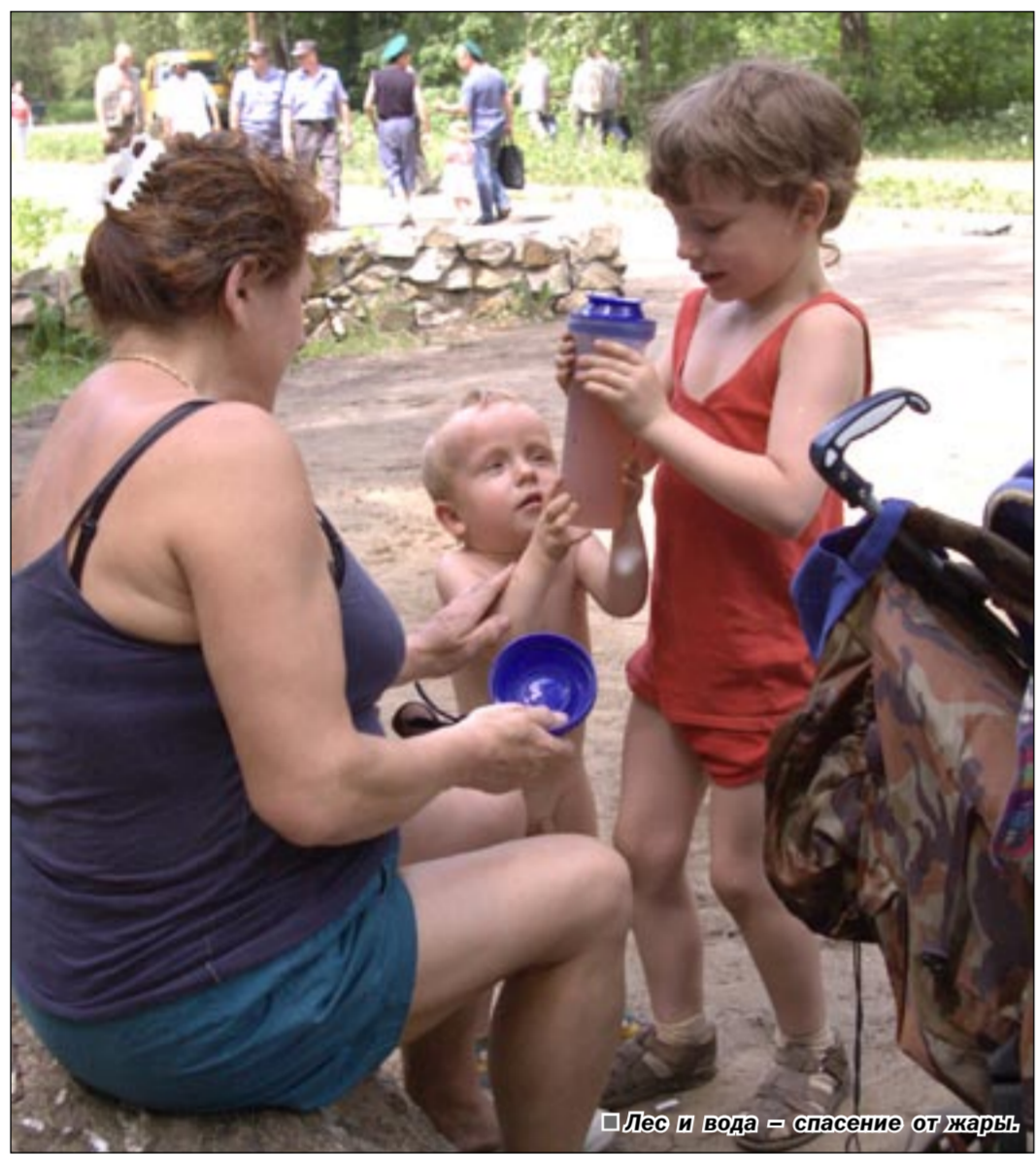
Лес и вода – спасение от жары.