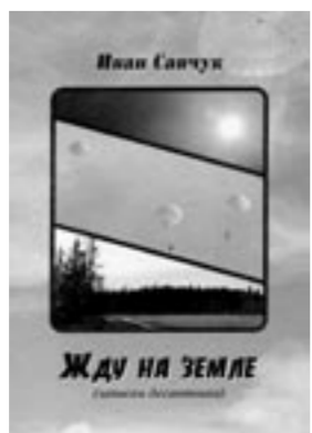
ЖДУ НА ЗЕМЛЕ