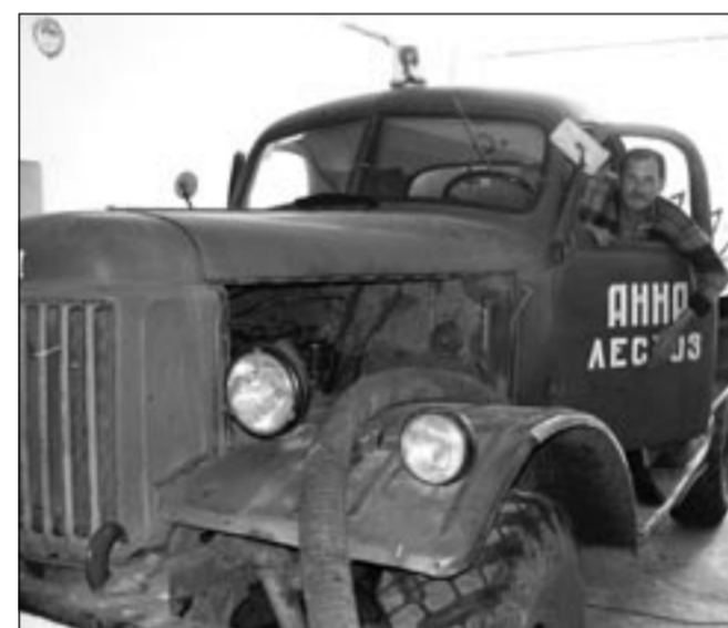
И такая техника ещё служит.