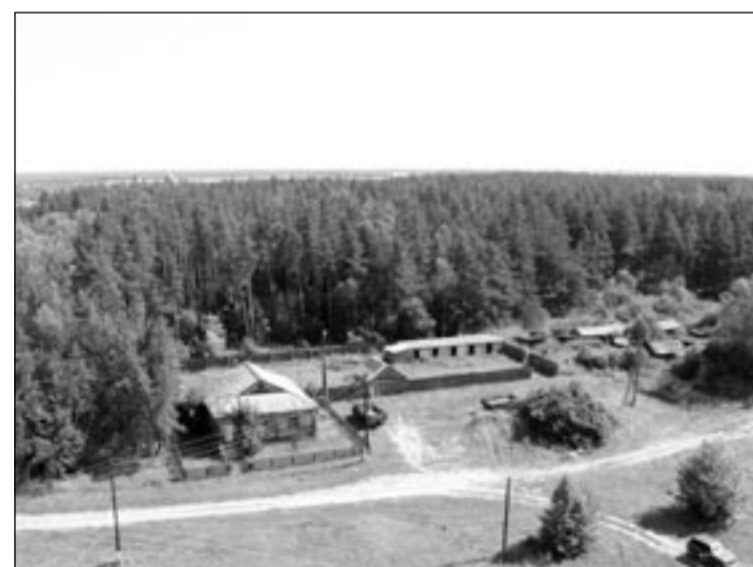
Окрестности Тишанки с высоты птичьего полета.