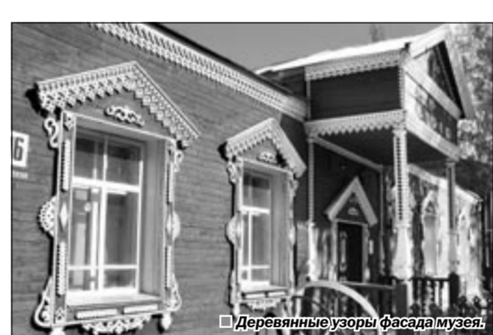
Деревянные узоры фасада музея.