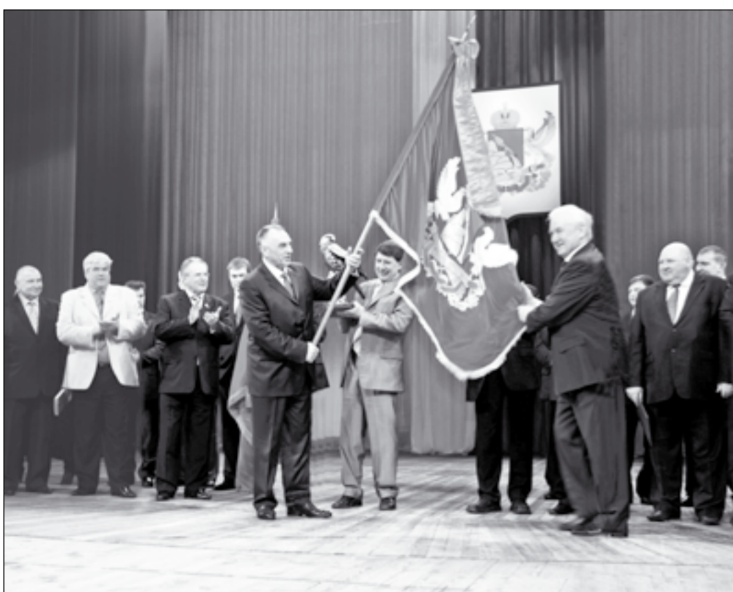
В апреле 2008 года Аннинскому району на вечное хранение передано переходящее знамя Воронежской области. Район трижды подряд становился победителем экономического соревнования работников АПК.