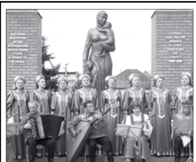
Вокальный ансамбль «Аннушка» у памятника Женщине-матери, труженице.

Аннинская земля – край древний и в то же время вечно молодой. Наши предки в боях с кочевниками отстаивали право жить на берегах Битюга. Благодатная и плодородная земля не только даёт высокие урожаи, но и способствует появлению талантов в науке, культуре, спорте. Это десятки имён как прошлого, так и настоящего.