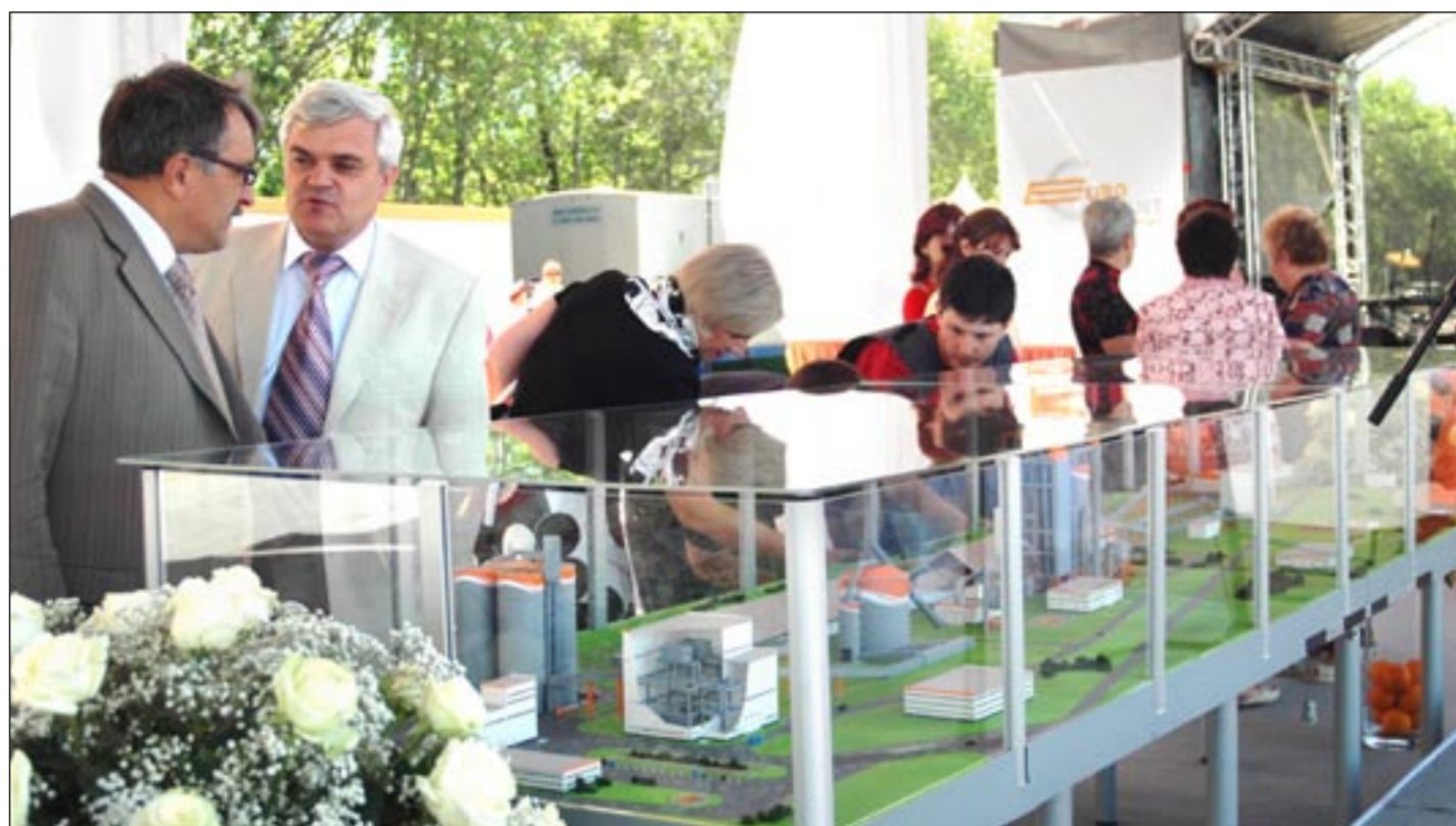
Новый Подгоренский цементный завод можно увидеть пока в макете. А когда он появится в реальности, не будет иметь аналогов в России.

Ключевым направлением экономического развития является рост конкурентной инновационной продукции, - считает губернатор Владимир Кулаков. - Поэтому привлечены отечественные и иностранные инвестиции нам нужны не