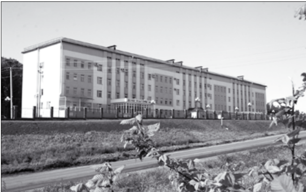
В прошлом году в Анне открыта новая поликлиника.