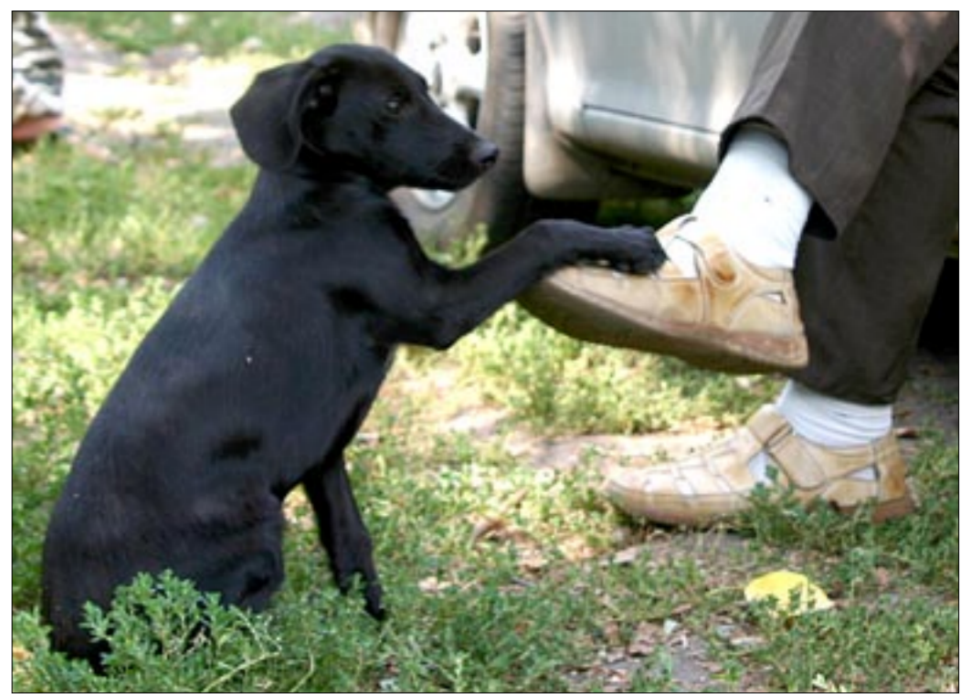
«Хозяин, купи мне лекарство!»