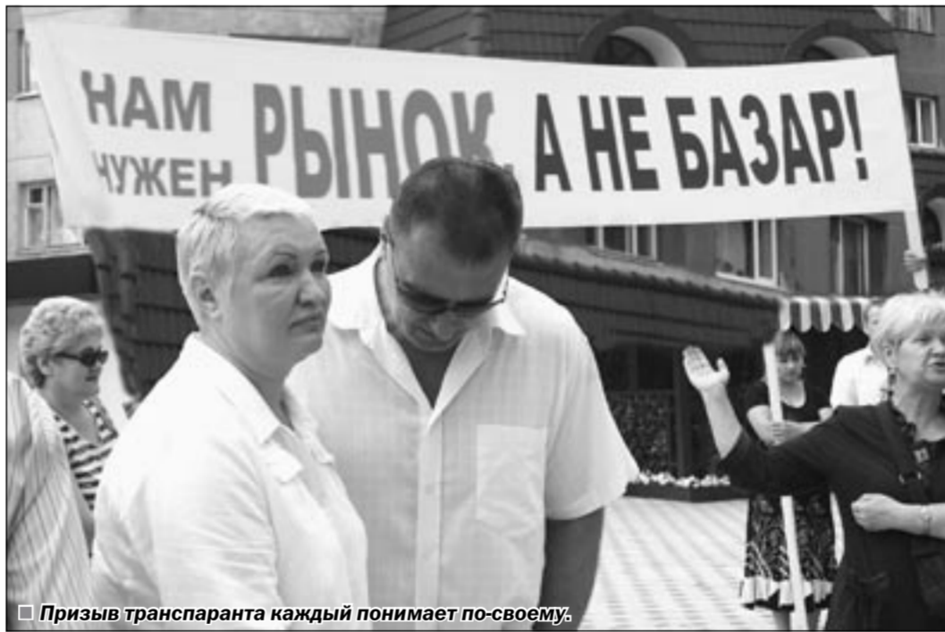
Призыв транспаранта каждый понимает по-своему.

Прошедший митинг не собрал тысячи горожан, как это бывает на протестных акциях коммунистов, да и вряд ли у него была такая задача - уж больно интерес частный. Но внимание СМИ привлёк. И непонятно, радоваться этому или огорчаться? Николай СТАРЫХ.