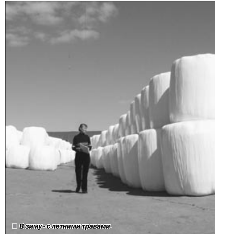
В зиму — с летними травами.