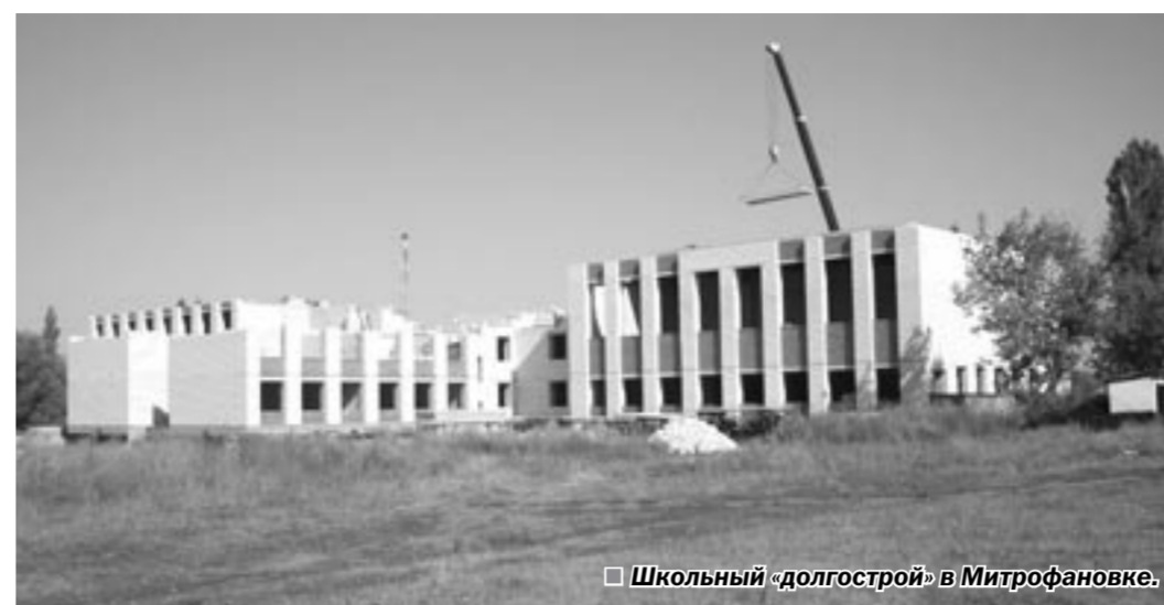
Школьный «долгострой» в Митрофановке.

А это означает, что при таких темпах труда новоселье выпадает в лучшем случае на осень 2010 года. Продержатся ли хотя бы к этому сроку без нежелательных опасных потрясений ветхие здания существующей школы - трудно сказать.