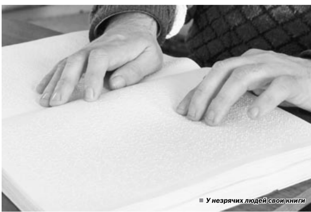
У незрячих людей свои книги

Всё перевернулось с ног на голову, когда развалилась страна. Тогда здоровым людям туго приходилось, не то что инвалидам. В то безвременье пришлось продать клуб, столовую, закрыть здравпункт. Государство решило, что всю инфраструктуру предприятия должны содержать сами. Да и не нужна она стала. Рабочие места сократились почти в двадцать раз. Потом «Импульс» и ему подобные перестали считаться учебно-производственными предприятиями. А раз так, то надо полностью платить все налоги, наравне с промышленными гигантами. Почти все предприятия общества слепых упали на колени.