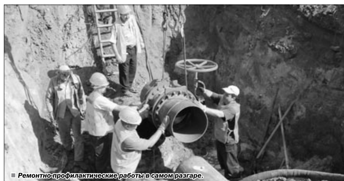
Ремонтно-профилактические работы в самом разгаре.