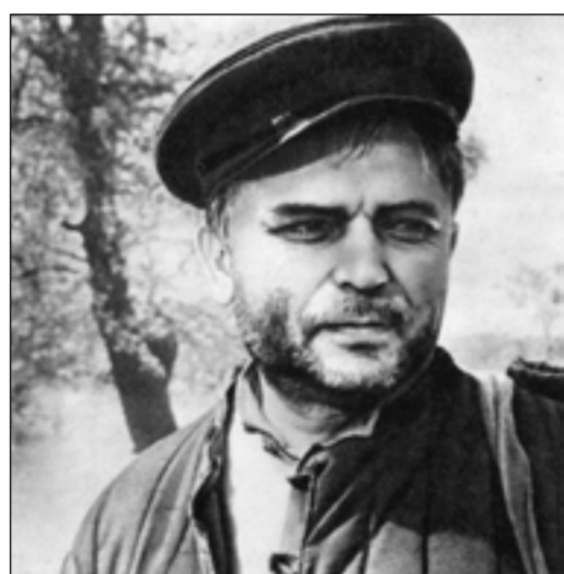
Сергей Бондарчук в фильме «Судьба человека».

По поводу второй радости - об идее «Коммуны» подвигнуть воронежцев на установку памятника литературному земляку Андрею Соколову - могу сказать одно: одобряю! Но у меня есть маленькое пожелание: мне очень хочется, чтобы своим обликом Андрей Соколов напомнил Сергея Бондарчука, сыгравшего главную роль в своём кинофильме «Судьба человека».