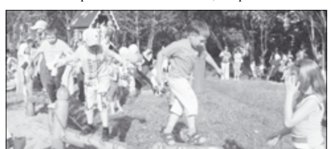
Подготовили Евгений ЗВОРЫГИН, Надежда ЖЕМОЙТЕЛЬ, Лариса ТАРАБРИНА.

Работы в этом направлении продолжатся. К своему юбилею поселок Грибановский станет чище и краше.