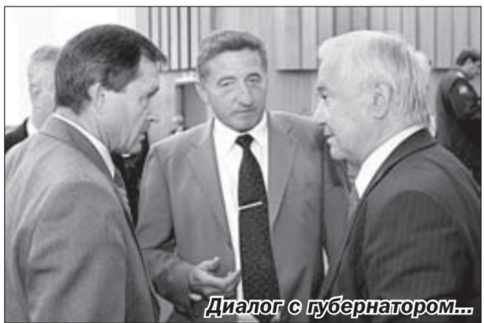
Диалог с губернатором...