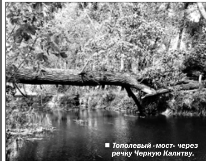
Топольный «мост» через речку Черную Калитву.

На юге Воронежской области лето нынче встретилось с осенью точно по календарю. В последние дни августа долгая изнуряющая жара сменялась желанной прохладой. При таких резких переменах в погоде сбываются обещанные синоптиками «штормовые предупреждения».