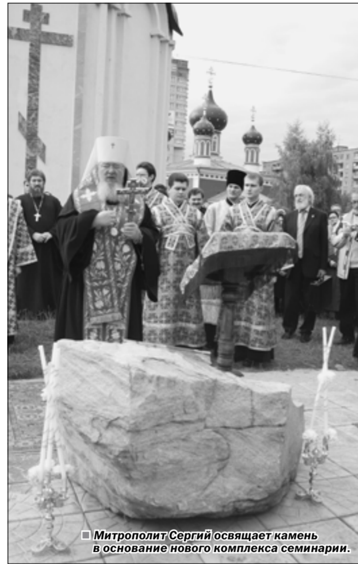
Митрополит Сергей освящает камень в основание нового комплекса семинарии.