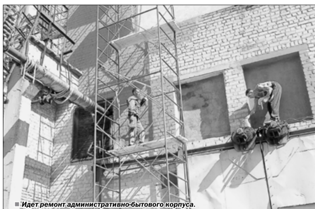
■ Идет ремонт административно-бытового корпуса.