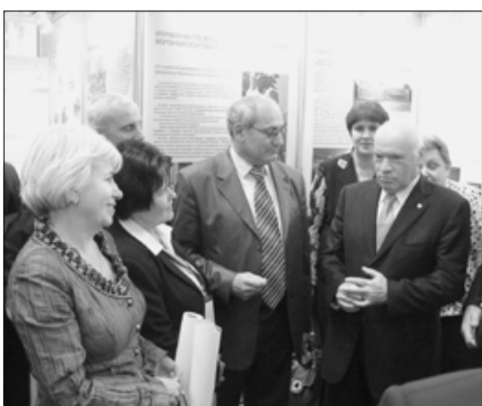
Президент Лиги здоровья нации, академик РАНМ Лео Бокерия посетил воронежскую экспозицию.

Воронежская область стала лауреатом выставки «Социальные проекты и программы», проходившей в Москве в рамках IV всероссийского форума «Здоровье нации — основа процветания России».