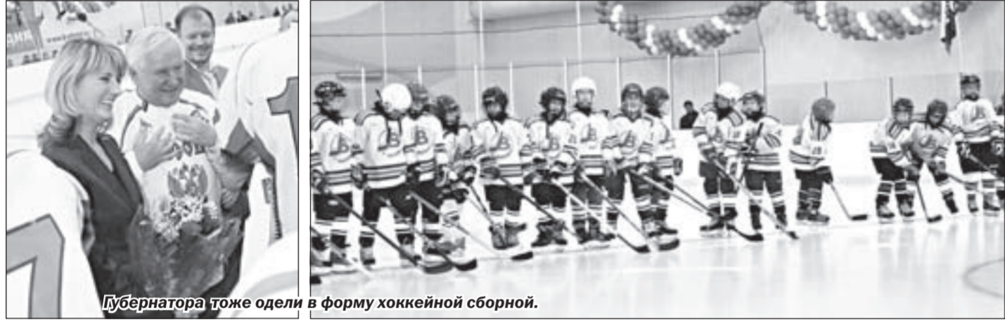
Губернатора тоже одели в форму хоккейной сборной.