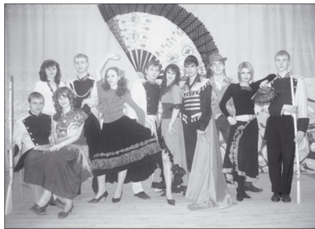
Актёры школьного театра.