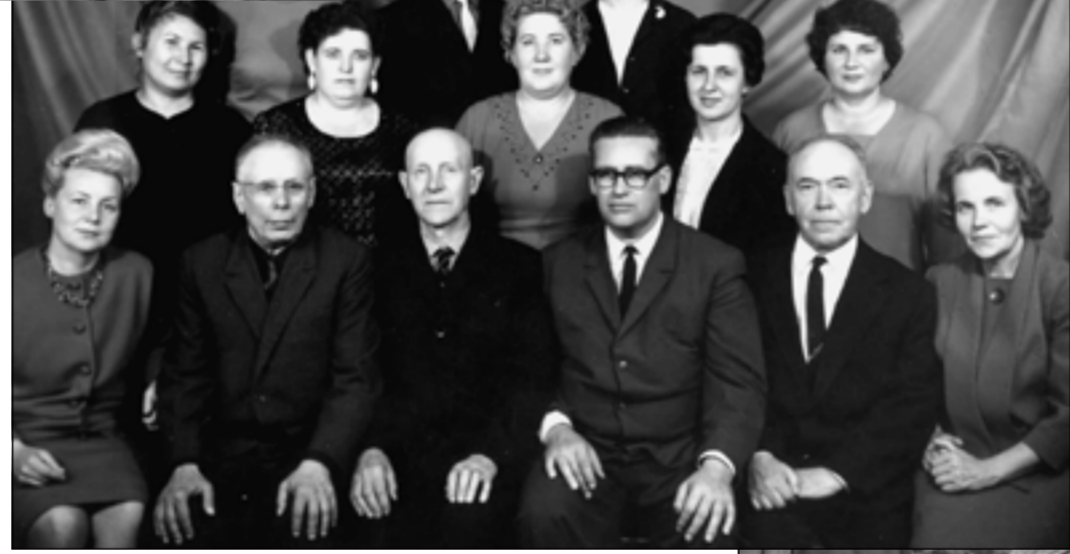
Первый послевоенный выпуск экономистов высшей квалификации. 1949 - 1969 гг.

обучаться дистанционно, на основе использования новейших информационных технологий.