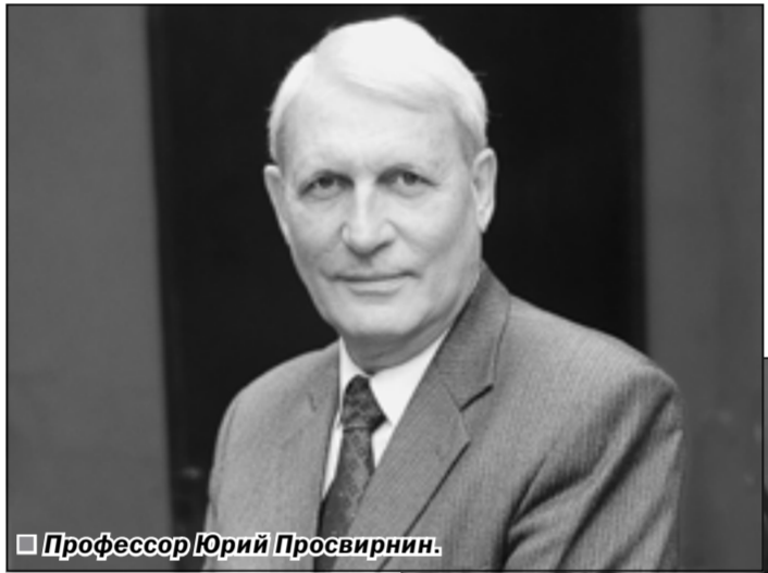
Профессор Юрий Просвирнин.