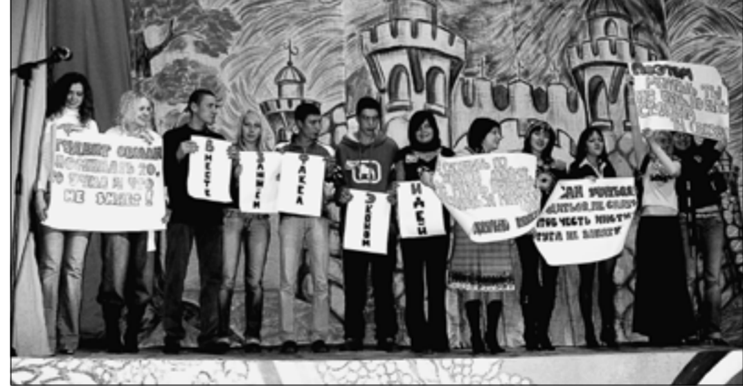
Студенты не только учатся, но и участвуют в художественной самодельности, например в «Студенческой весне».

Преподаватели института постоянно ведут работу над обновлением учебников и учебных пособий, совершен-