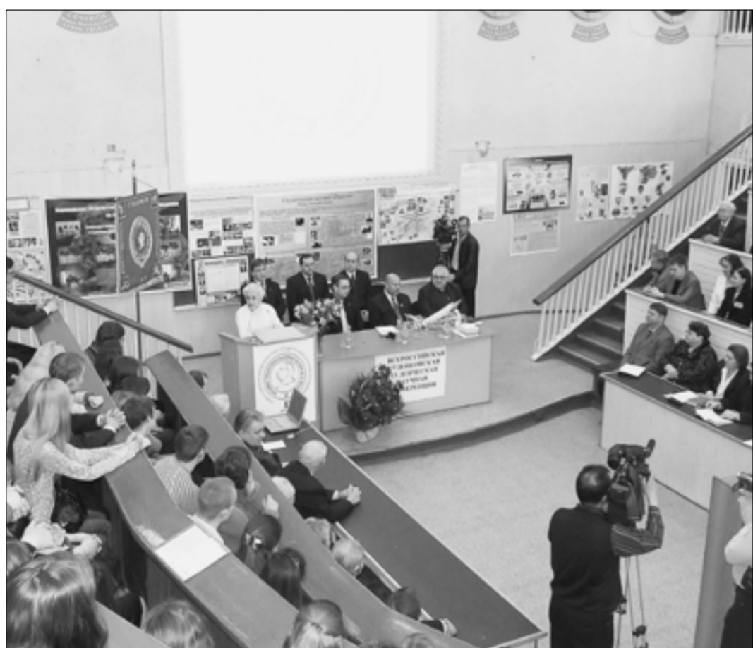
Центральная медицинская аудитория ВГМА. IV Всероссийская Бурденковская студенческая конференция, посвященная юбилею академии.