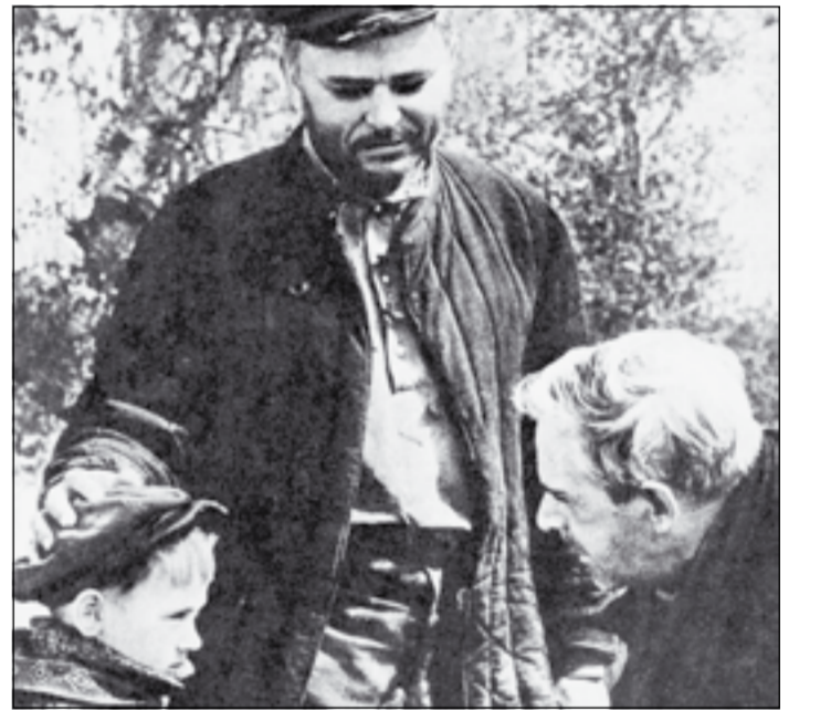
Кадр из фильма «Судьба человека».