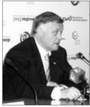
■ Президент ОАО «Российские железные дороги» Владимир Якунин.

За 10 лет, прошедших с начала реформы железнодорожного транспорта, частные компании, владеющие подвижным составом, стали полноправными участниками рынка железнодорожных услуг. К 1 октября 2008 года парк частных грузовых вагонов составляет 555 тысяч, из них 171 тысяча –