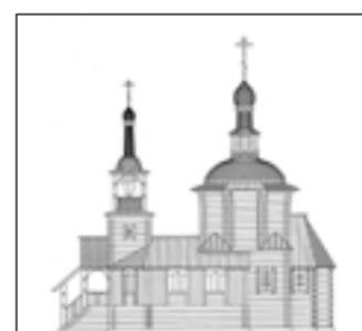
Таким будет храм.

Согласно проекту, храм займёт 50 квадратных метров и достигнет высоту 21 метр. По словам Бориса Затонского,