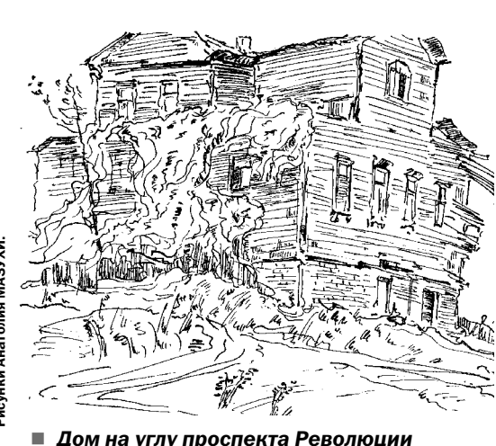
■ Дом на углу проспекта Революции и Чернавского спуска (1961 год).