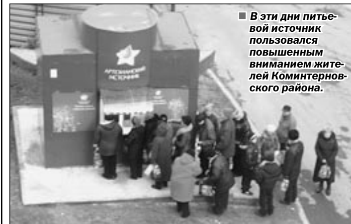
В эти дни питьевой источник пользовался повышенным вниманием жителей Коминтерновского района.

Без воды остались шесть кварталов (№ 9, 15, 16, 17, 18, 18А) Северного микрорайона, а это порядка 150 домов, где проживают около 30 тыс. человек. Случилось это в понедельник в Коминтерновском районе Воронежа в результате прорыва в районе Авторынка (ул. Хользунова, 116) водопроводной трубы диаметром 600 мм, - сообщили в пресс-службе главного управления МЧС России по Воронежской области.