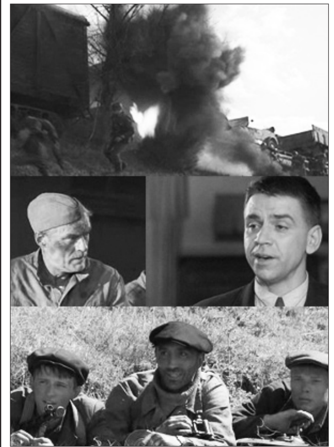
Кадры из фильма «Сапёры».