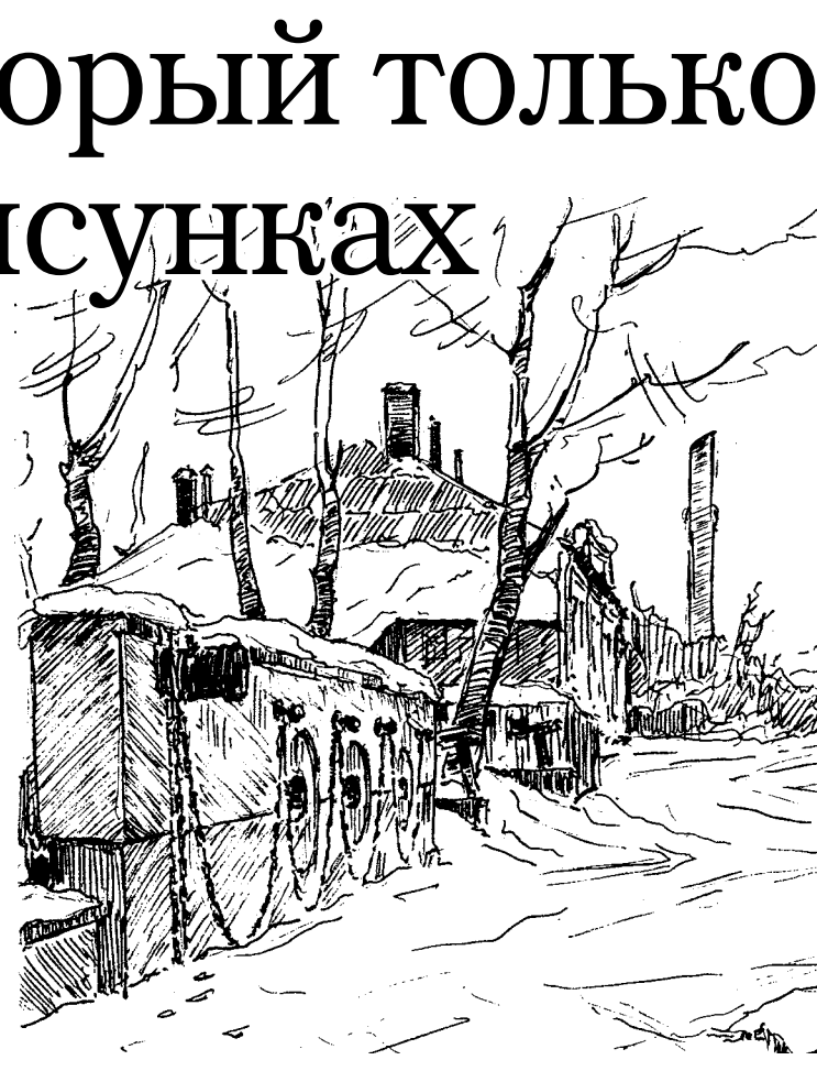
■ Дом возле Петровского сквера (1995 год).