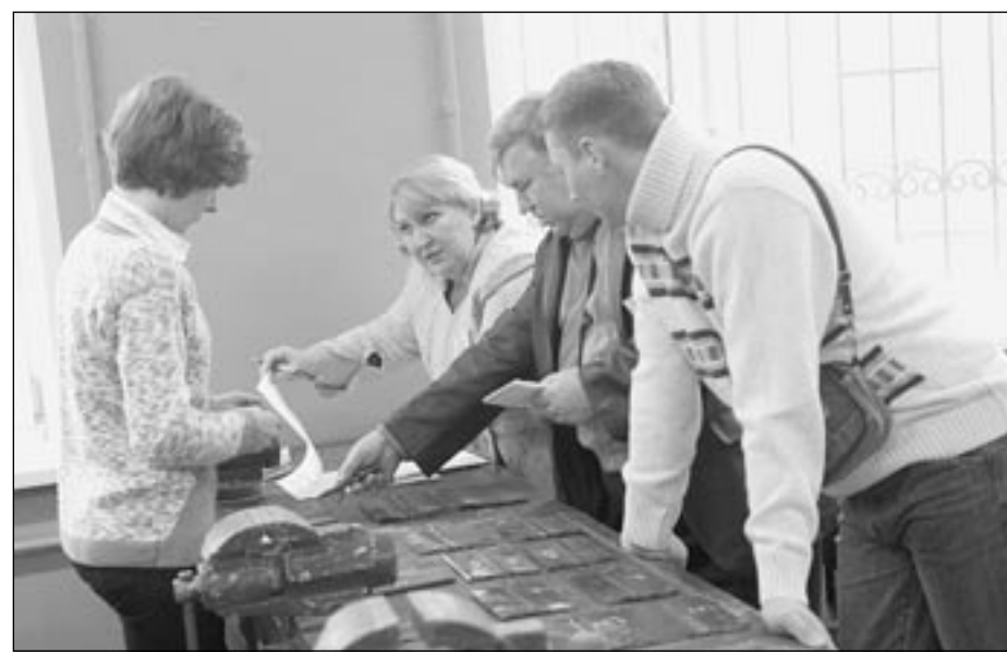
■ Мгновения конкурсного состязания и награждение лучших по профессии.