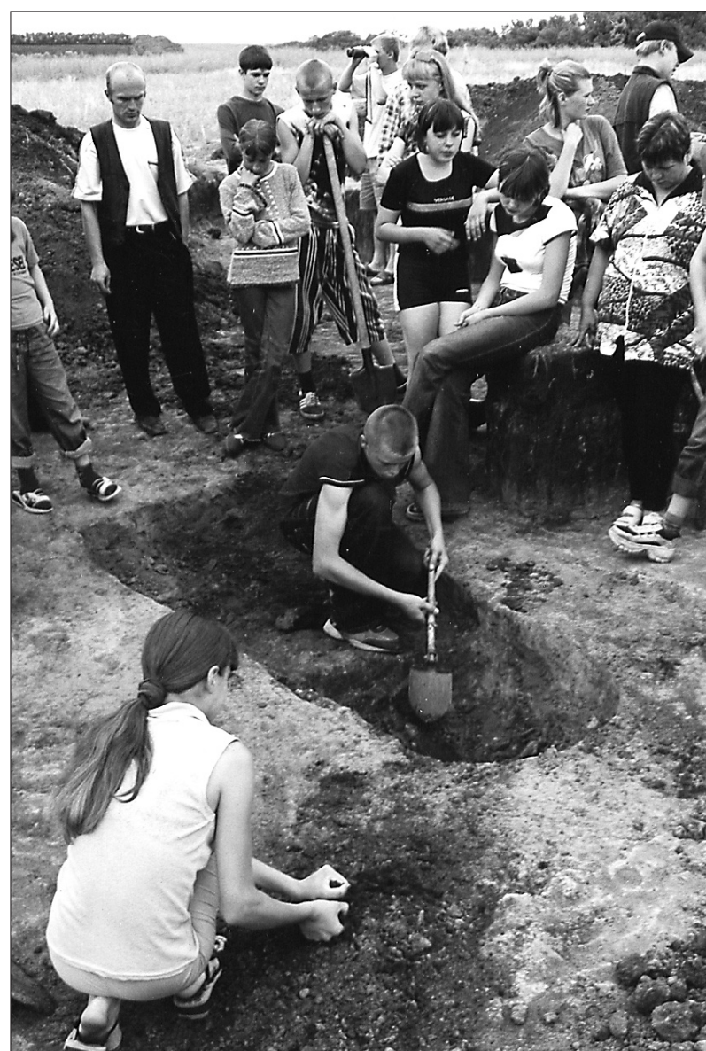
Юные археологи в «квадрате раскопа».