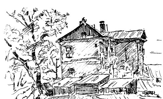
■ Старый особняк, стоявший на углу улиц Кольцовской и Карла Маркса (1967 год).