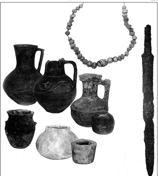
Древние «гости»: сарматский меч, их же кувшины и ожерелье.

скифского времени, две с половиной, даже чуть больше, тысячи лет тому. «Отрыть» сведения о земляках – народах уже нашей эры. Речь о сарматах (начальные века) и половцах (XII – начало XIII веков).