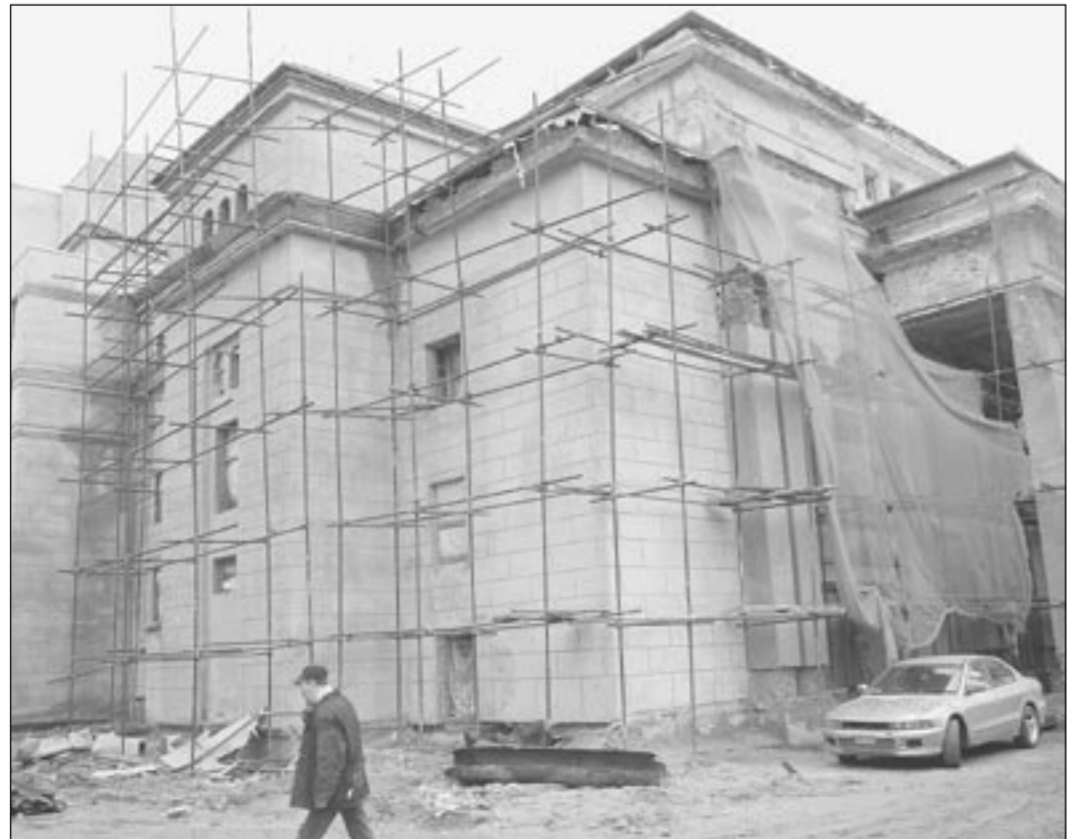
Старое здание драмтеатра в строительных лесах - снаружи и внутри. О ходе реконструкции исторического здания - на 2-й странице

Заполненный талон вышлите или принесите в редакцию по адресу: 394036, г. Воронеж, ул. Комиссаржевской, 4-а. Тел. (4732) 39-00-87.