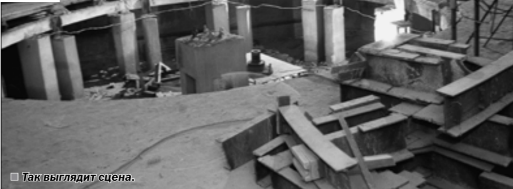
Таким выглядит сцена.

В последние дни осени работы в старом здании Академического театра драмы имени А.В. Кольцова велись довольно-таки интенсивно. Сейчас, проходя мимо него, мы уже вполне отчетливо различаем будущие очертания обновлённого театра.