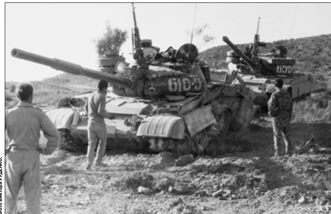
Водителю-механику танка Ивану Огуле, уроженцу Россошанского района, повезло: он остался жив после подрыва танка на mine. Август 1986г.