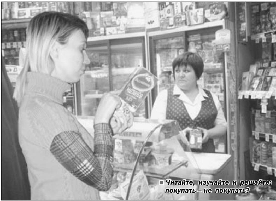
Читайте, изучайте и решайте: покупать — не покупать?

При оформлении и выдаче новых санитарно-эпидемиологических заключений на технические документы и продукцию особое внимание будет обращено на соответствие терминологии, требования безопасности и маркировку. Если, начиная с 19 декабря, технические документы, по которым сейчас выпускаются молоко и молочная продукция, не будут изменены на новые, производители ждут неприятные последствия — Управление Роспотребнадзора по Воронежской области будет обращаться в прокуратуру. Кстати говоря, за девять месяцев 2008 года специалистами Роспотребнадзора уже проверили 19 предприятий молокоперерабатывающей промышленности и 400 организаций торговли по реализации молочной продукции. В результате выяснились стившие уже традиционными нарушения санитарного законодательства: не проводился своевременный текущий ремонт помещений, а на товарной упаковке отсутствовала информация о наличии в составе продукции стабилизаторов. Последнее замечено у про-