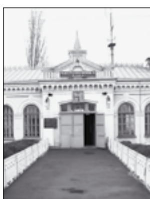
Этот вокзал помнит Льва Толстого.

Неблизко от Москвы, на 812-м километре по железнодорожной магистрали Центр - Юг, стоит Митрофановка. Это станция и большое село по меркам не только здешнего Кантемировского района, но и областного. Мемориальная доска у входа в вокзал напоминает, что эти края посещал великий русский писатель Лев Толстой.