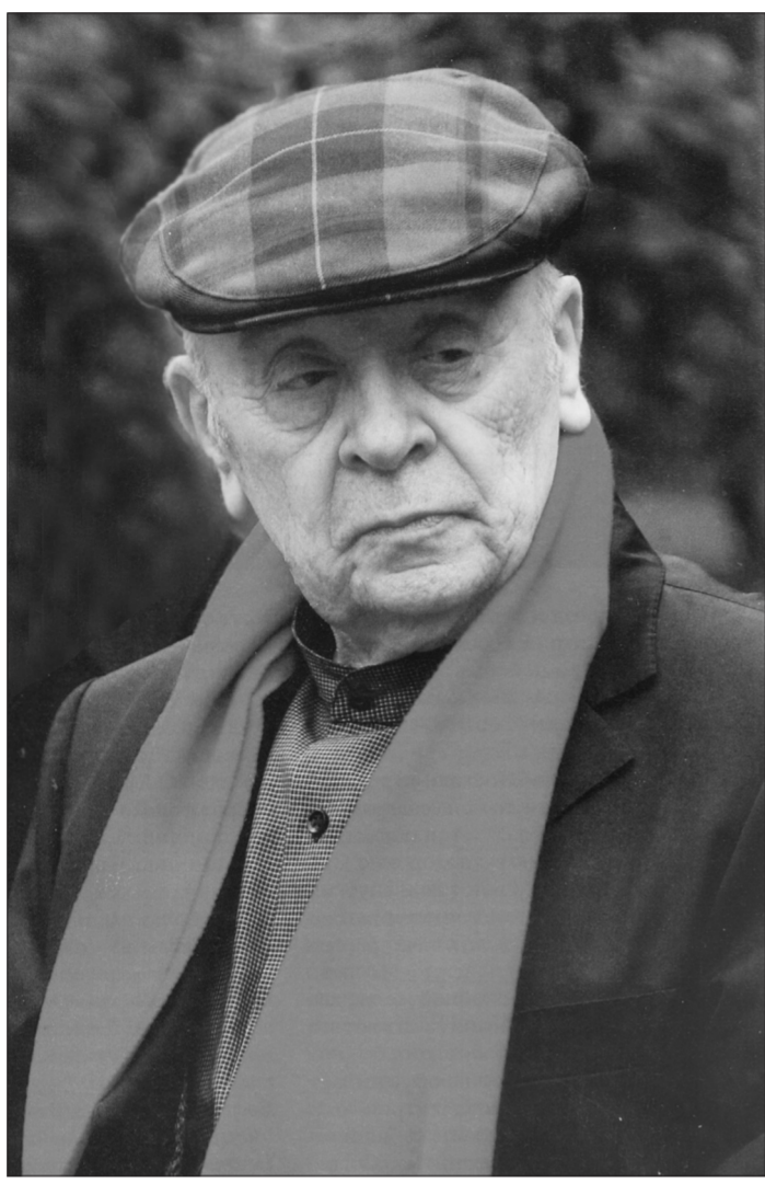
Народный артист СССР Леонид Броневой.