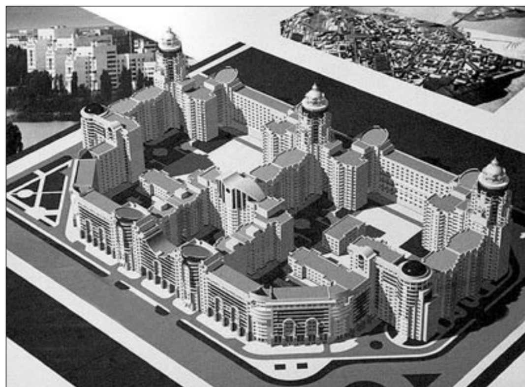
Появилась надежда, что город будет развиваться по плану.

Вторым важным документом, принятым сегодня, стал Генеральный план Воронежа. Почти 37 лет в последний раз принимался подобный документ, но срок действия его истек. Также настала пора уточнить параметры социально-экономического развития города. Вот и появился наконец новый генплан, в разработке которого принимали участие 94 организации. Все необходимые и предшествующие мероприятия соблюдены – публичные слушания состоялись, областная администрация