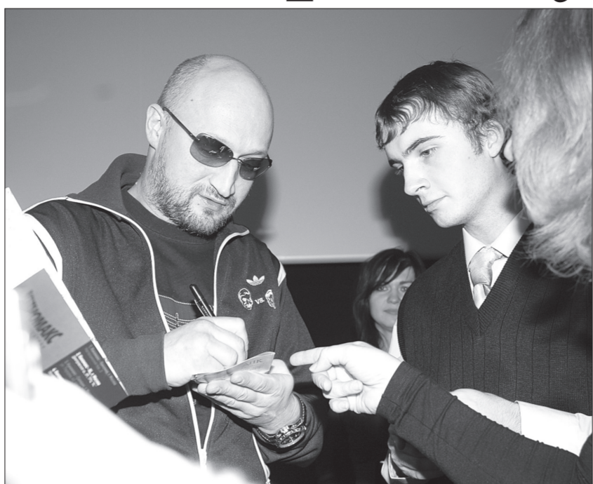
В Воронеже оказалось много любителей взять автограф у Гоши Куценко.

Когда они пошли меня провожать, я почему-то стал врать им, что я известный актёр и снимаюсь у Спилберга, — вспоминает Гоша Куценко. — Сразу после этих слов они на меня напали. А когда мы с группой выехали из Союза, нас предупреждали, что на чужой стороне запрещено брать — во избежание инфекций, передающихся через кровь. Когда парень приставил ко мне огромный нож, который у него откуда-то взялся, я вдруг посмотрел в