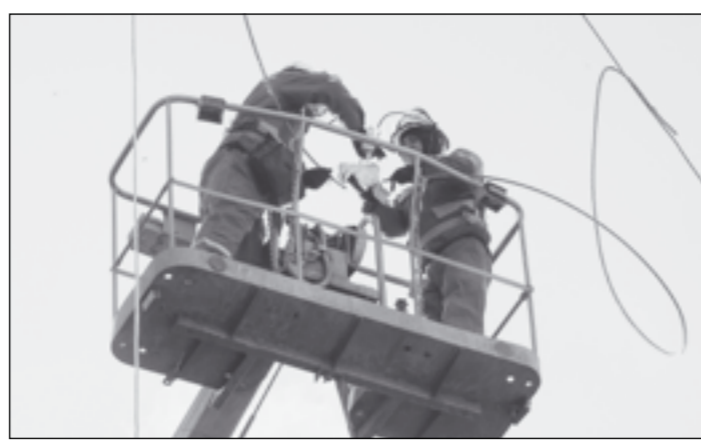
Трудовые будни и праздники.