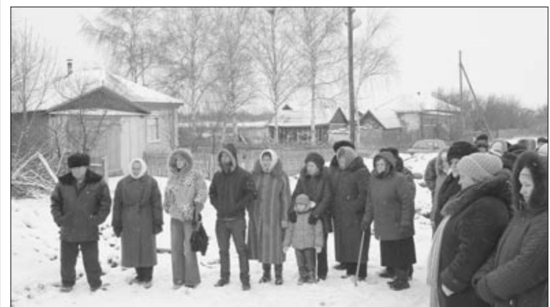
На праздник пришли жители не только Заречной улицы...