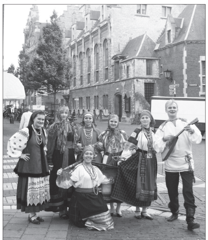
Коллектив «Радовеси» в Голландии.