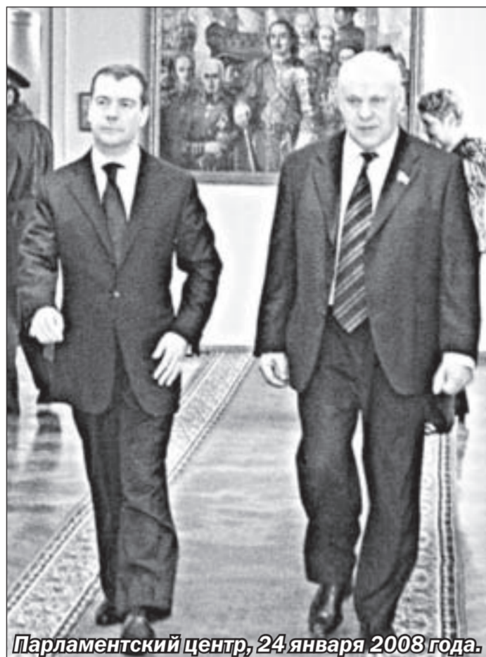
Парламентский центр, 24 января 2008 года.

В Парламентском центре состоялось юбилейное, 200-е, заседание областной Думы (первое заседание регионального