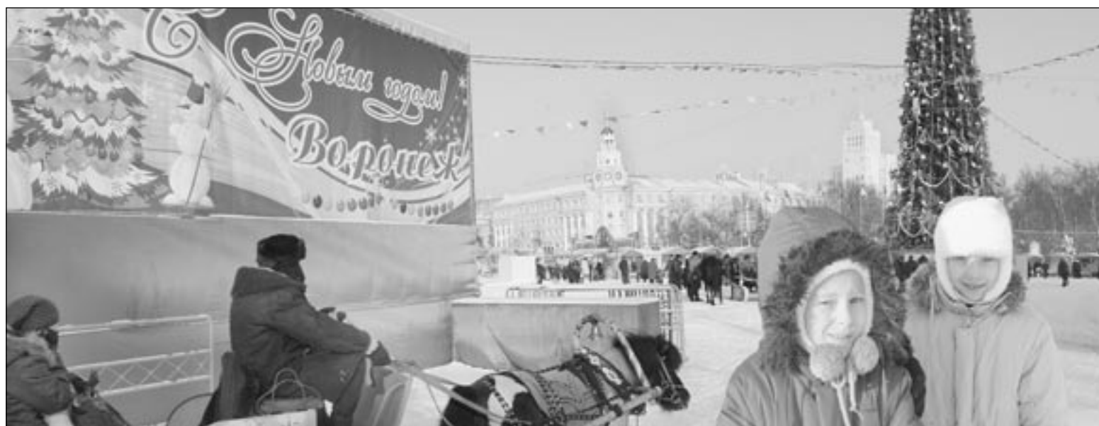
У главной ёлки Воронежа.

Добавим, что в ближайшее время служба «Скорой медицинской помощи» Воронежской области и ВТЦМК будут укомплектованы системой спутниковой навигации и позиционирования машин. Мониторинг слежения предлагается оборудовать диспетчерские службы в каждом районе, имеющем систему навигации. Таким образом, будут созданы условия для выбора наиболее оптимального маршрута движения машин, а время от поступления вызова до прибытия бригады к месту назначения значительно сократится.