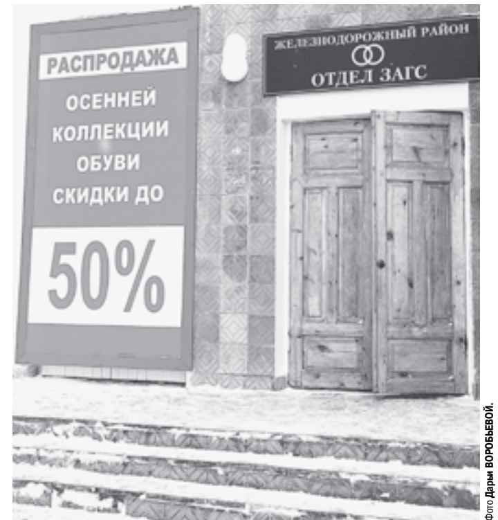
Скидки для новобранных?