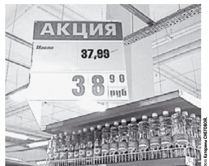
Акцией по покупателю!