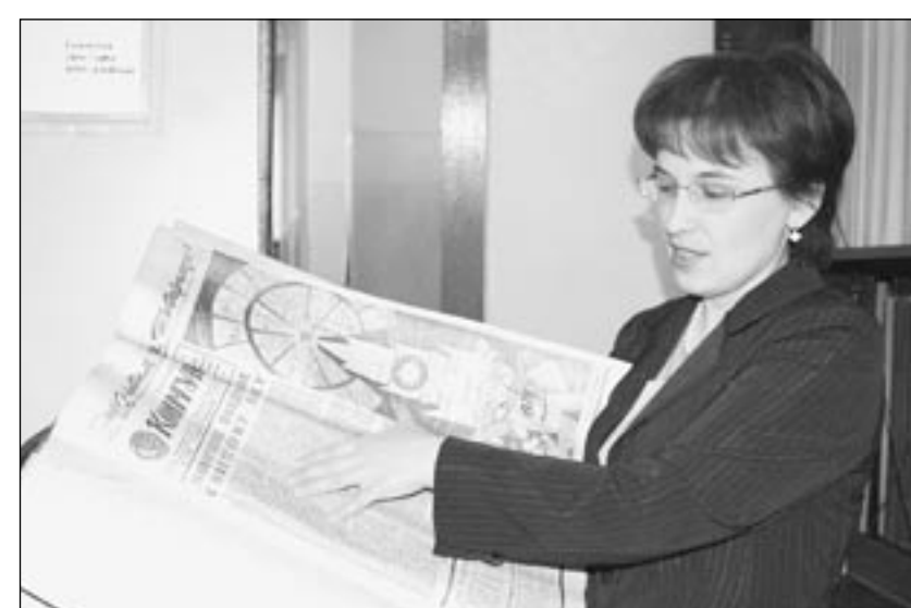
Подшивки газеты «Коммуна», хранящиеся в «Никитинке», представляют собой наиболее полную летопись воронежского края за последние 90 лет.