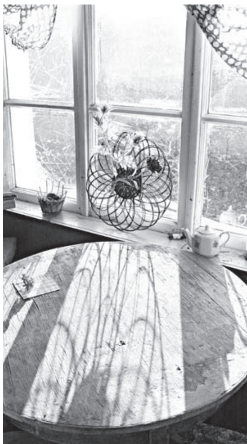
Солнце смотрит на вёсны...