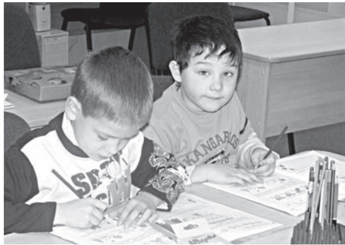
В Центре «Парус надежды» дети-инвалиды получают тепло и ласку тех, кто заботится о них, как о родных детях.

Инклюзивное образование предполагает, что все дети, несмотря на свои физические, интеллектуальные и иные особенности, могут обучаться вместе со сверстниками в массовой школе по месту жительства. Это обучение разных детей в одном классе, а не в специально выделенной