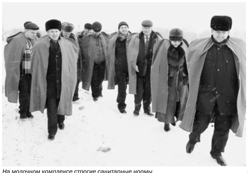
На молочном комплексе строгие санитарные нормы.