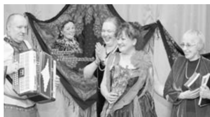
На вечеру в библиотеке искусств.