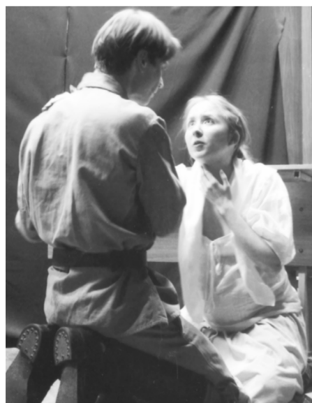
Сцена из спектакля «В воскресенье на войну».

Уже год, как в городской библиотеке искусств имени А.С.Пушкина проходят театральные встречи для детей