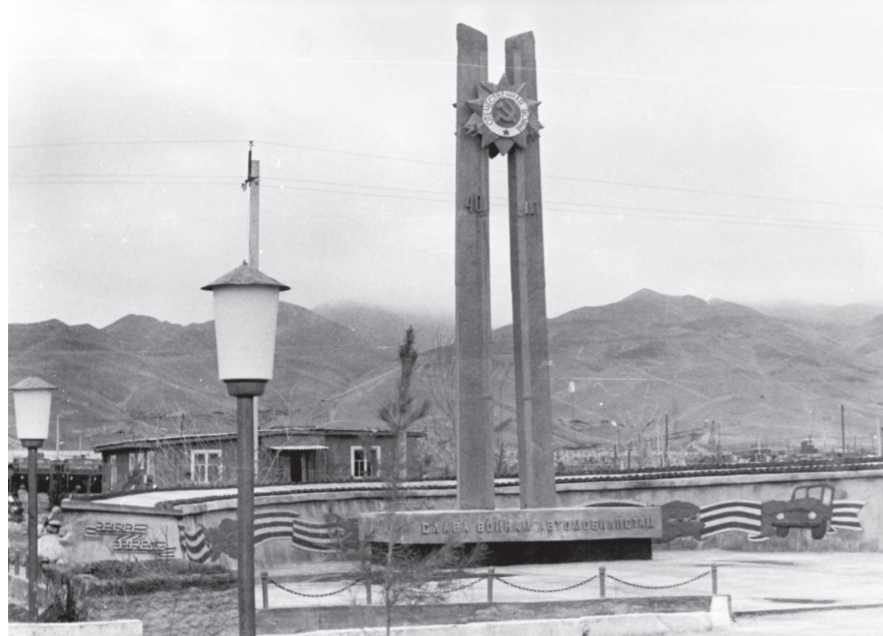
Памятник в военном городке Пули-Хумри.