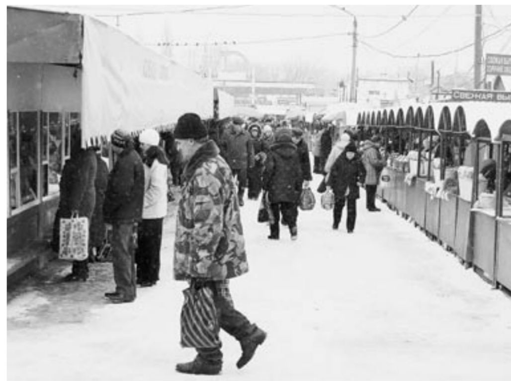
... А рынок работает.