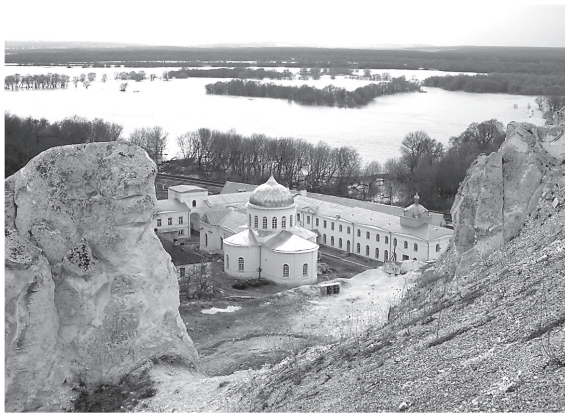
Дивногорье. Монастырь. Разлив.

На новую работу вышел в субботний день. Напарник на бегу показал, как управлять павильонной камерой. И исчез по своим неотложным делам. А к ателье свадебный поезд подкатил. У меня руки затряслись – вдруг «спартачу». Снимки не получатся, а событие ведь непостоянное.